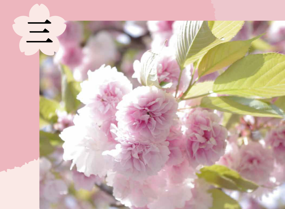
サトザクラ(フゲンゾウ)