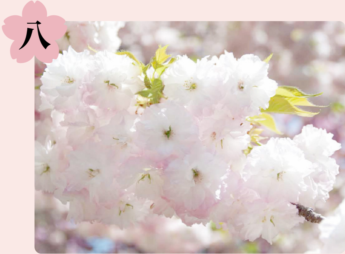
サトザクラ(ショウゲツ)