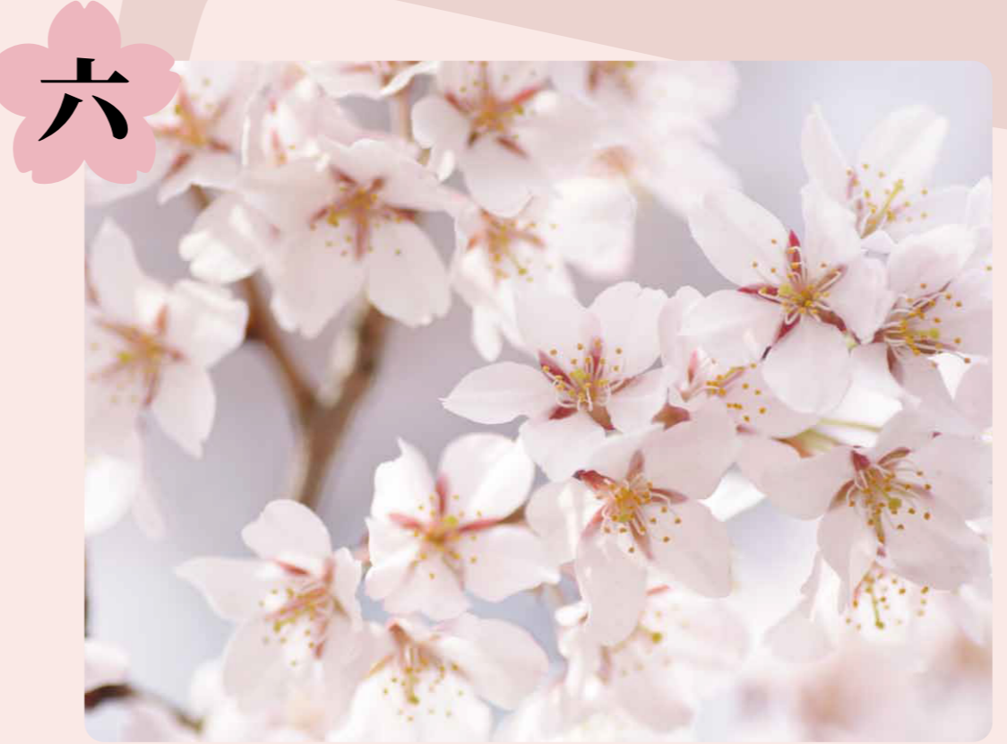
エドヒガンザクラ