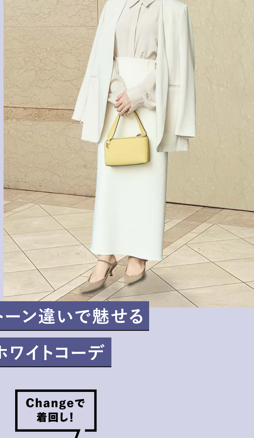
トーン違いで魅せる ホワイトコーデ