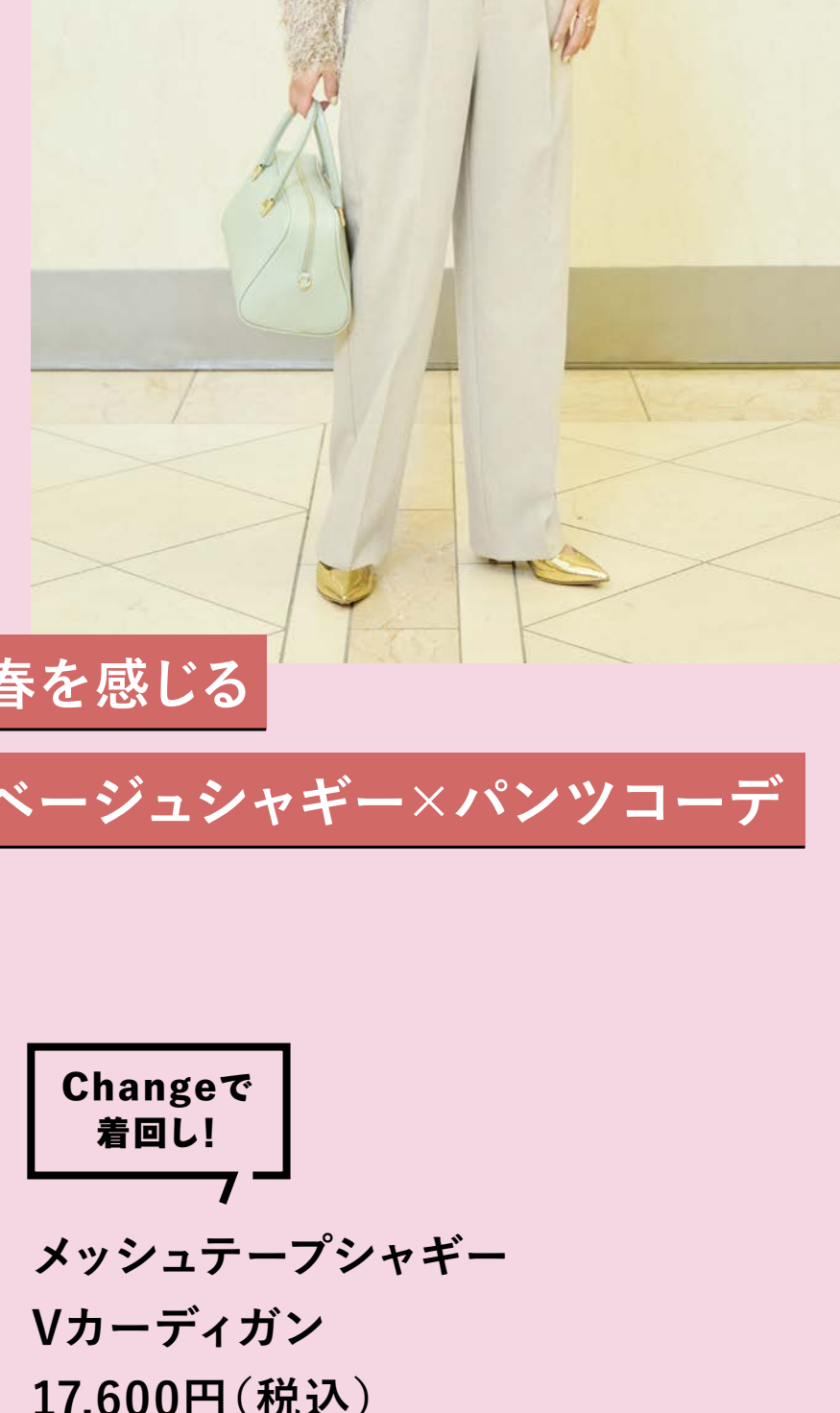
春を感じる ベージュシャギー×パンツコーデ