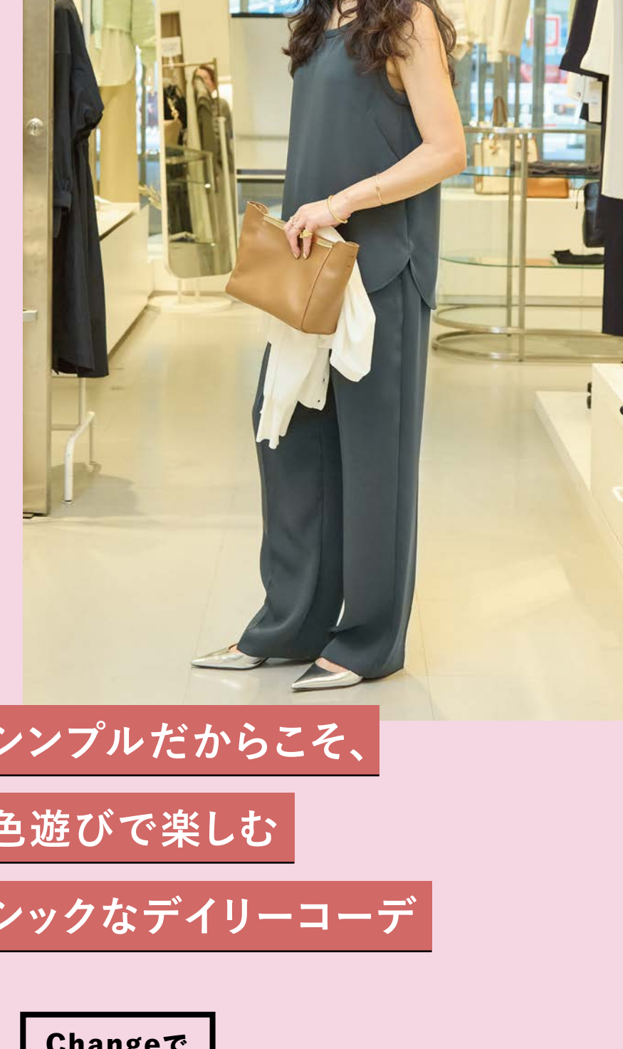
シンプルだからこそ、 色遊びで楽しむ シックなデイリーコーデ