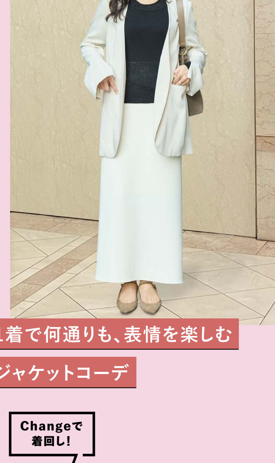
1着で何通りも、表情を楽しむ ジャケットコーデ