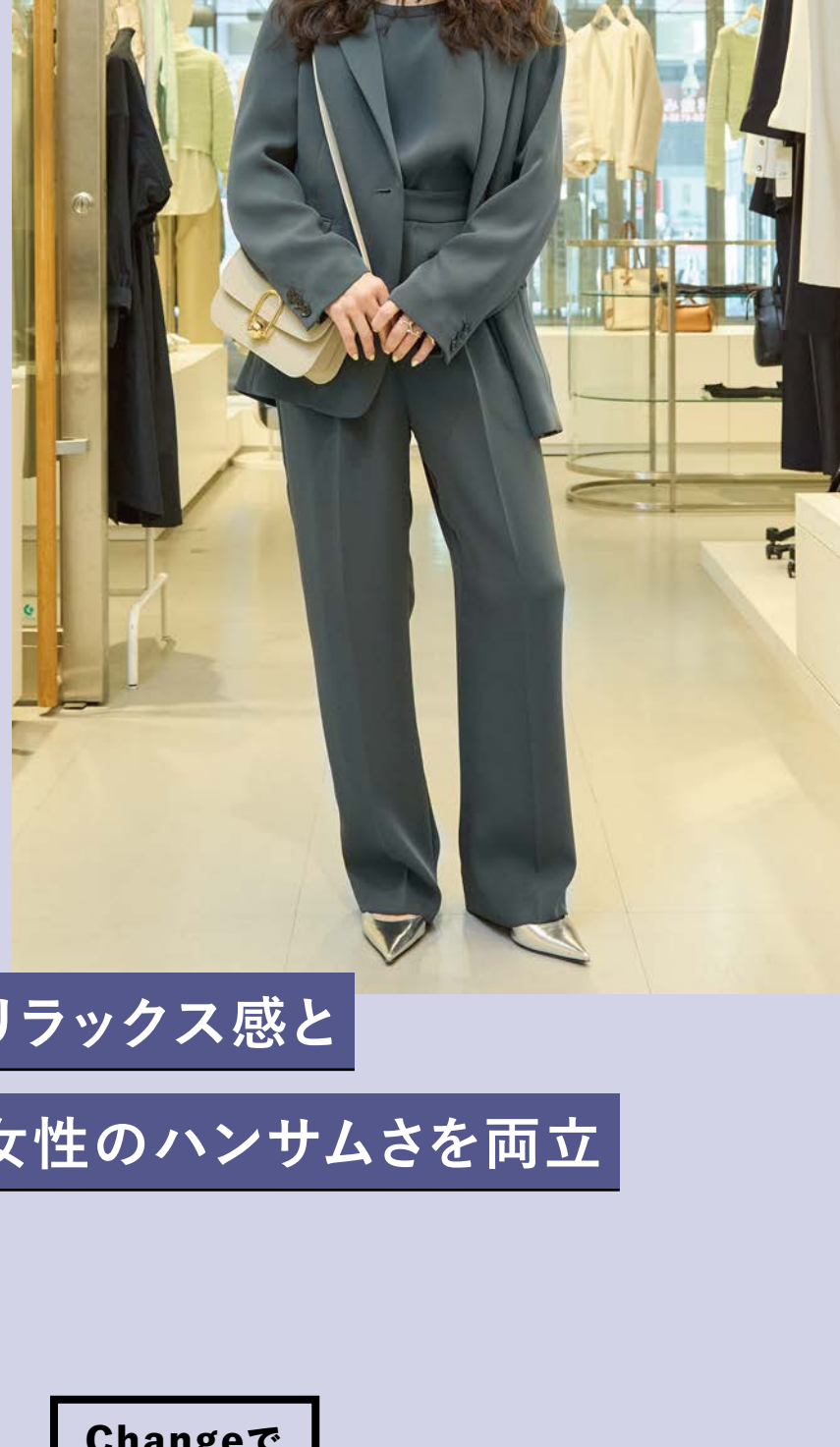
リラックス感と 女性のハンサムさを両立