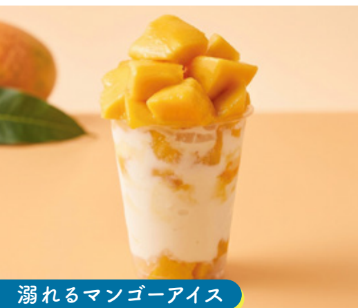
溺れるマンゴーアイス