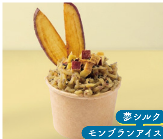
夢シルク モンブランアイス