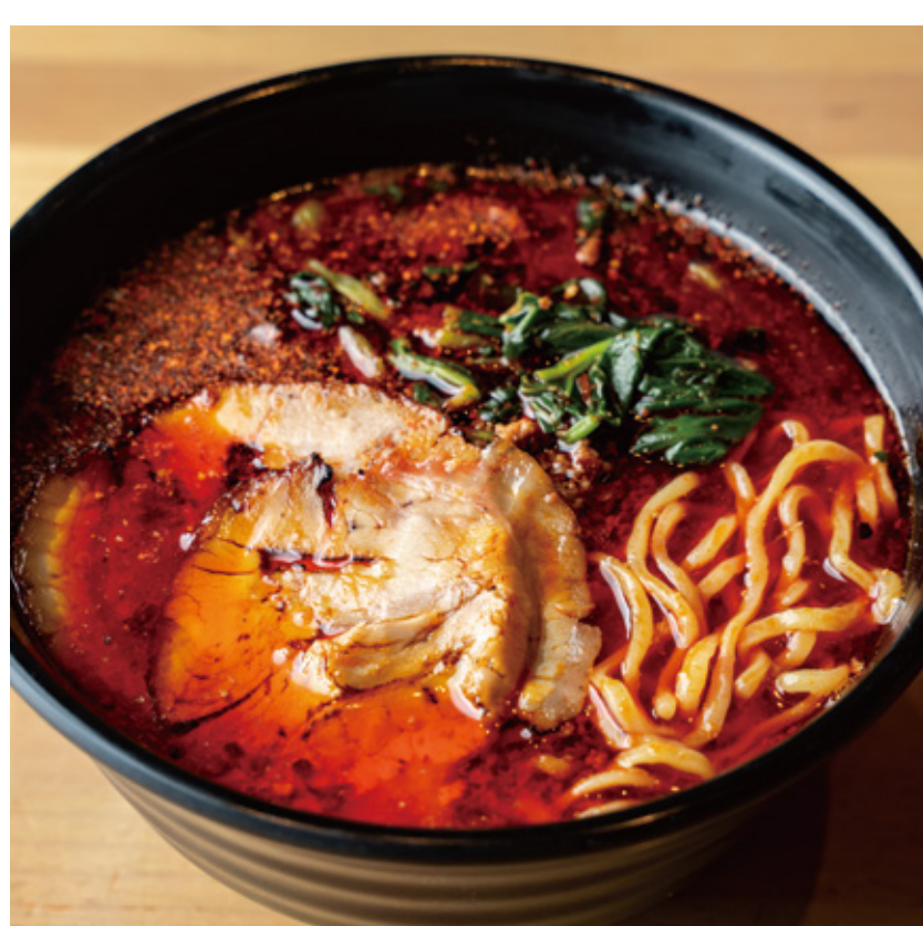
激辛担々麺 880円(税込) ※各日なくなり次第終了