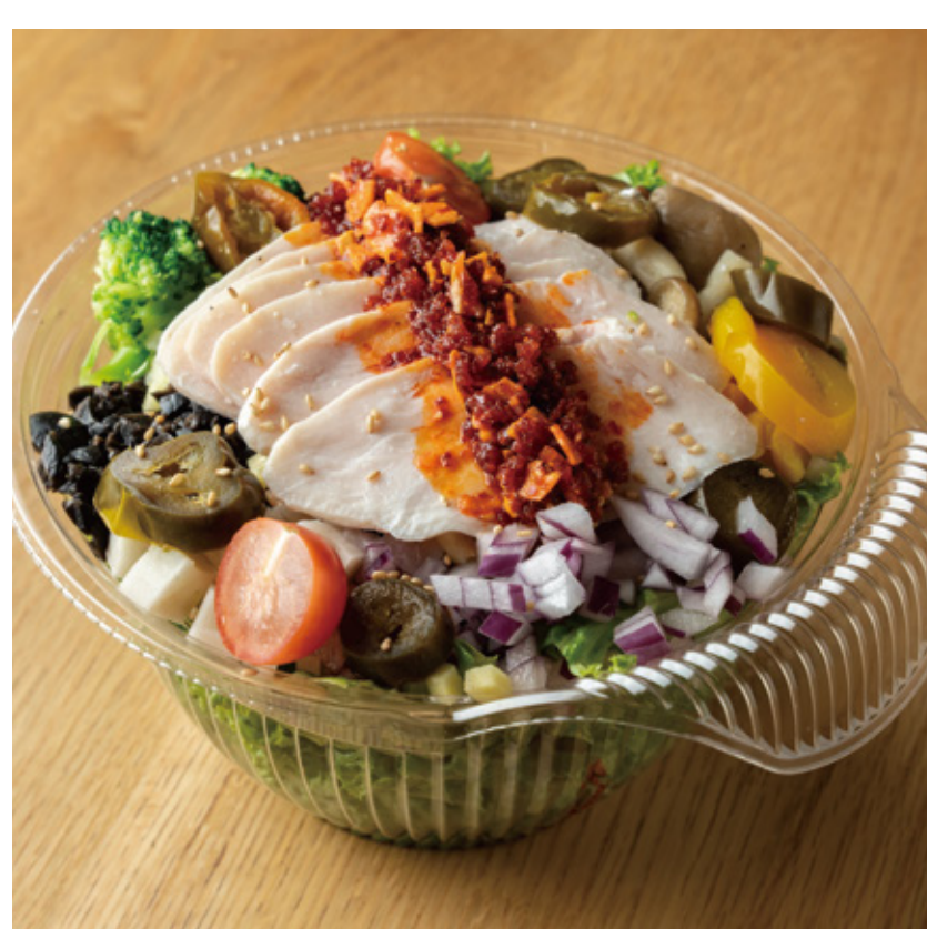
旨辛チキンとハラペーニョのサラダ 1,500円(税込)