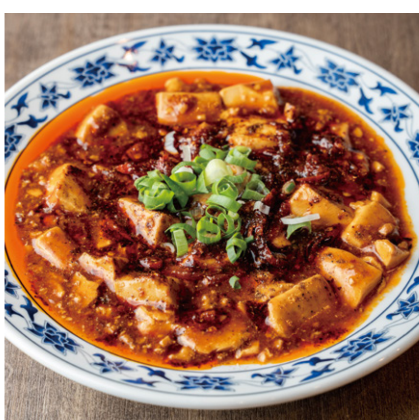
麻婆豆腐(イトイン・葱葉) イトイン 1,100円(税込)/葱葉 750円(税込)