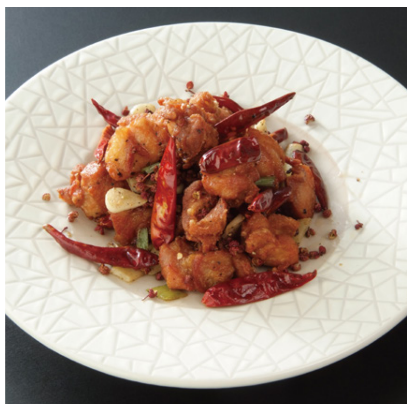
鶏肉の辛味山椒風味 2,200円(税込)