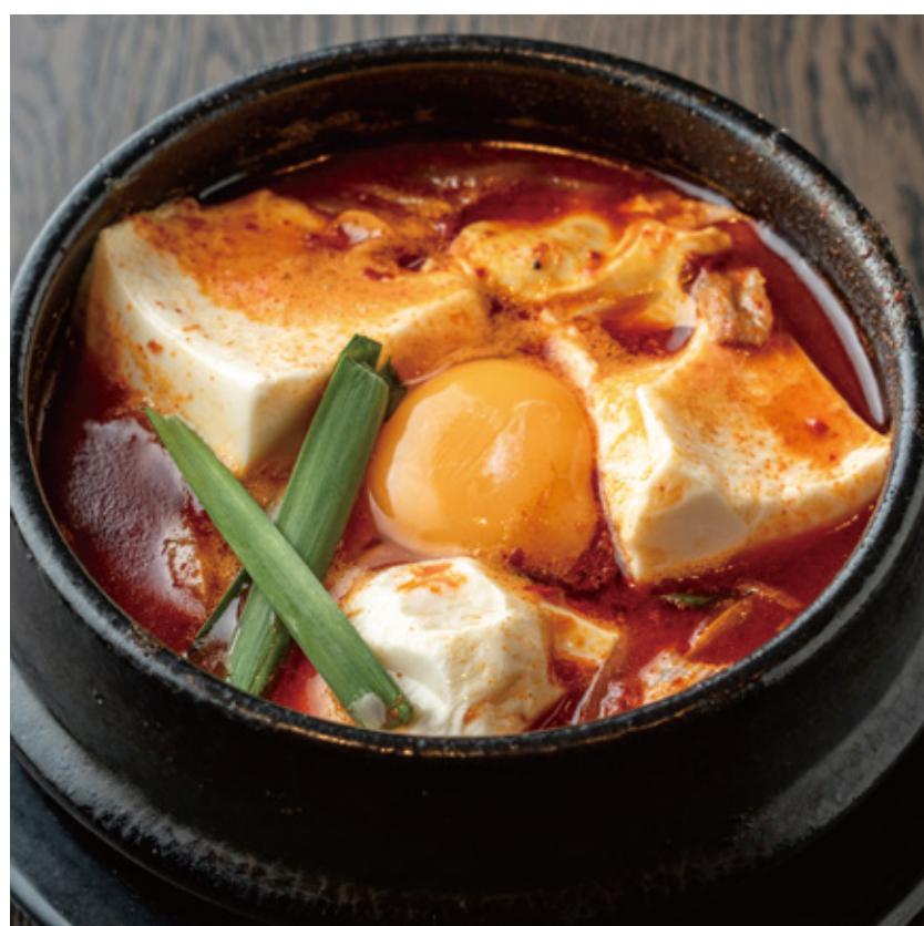
辛さ倍! スンドゥブチゲ 1,400円(税込) ※ランチタイムはセット、ディナータイムは単品でのご提供 ※各日なくなり次第終了