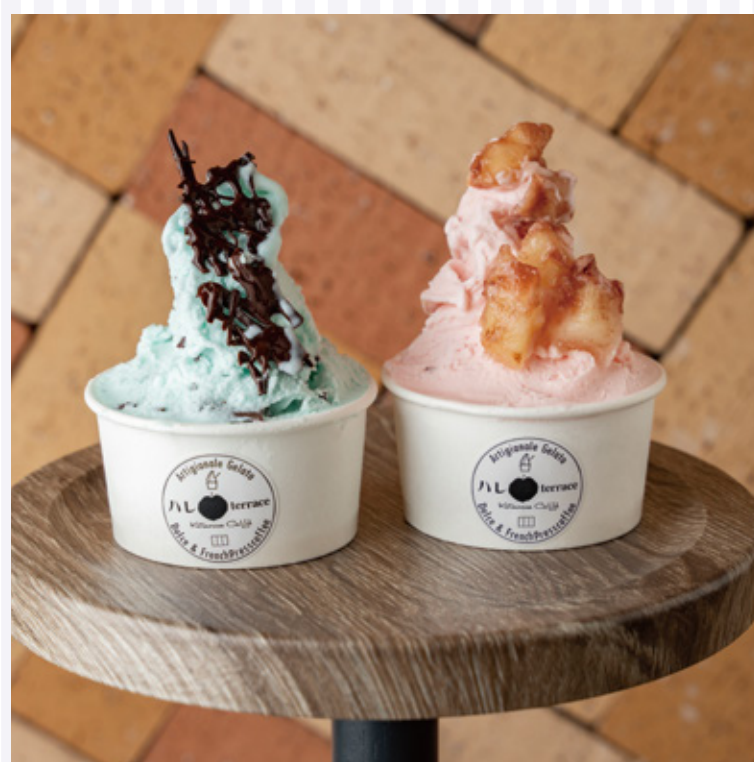
イタリアンジェラート (チョコミント・ももみるく)