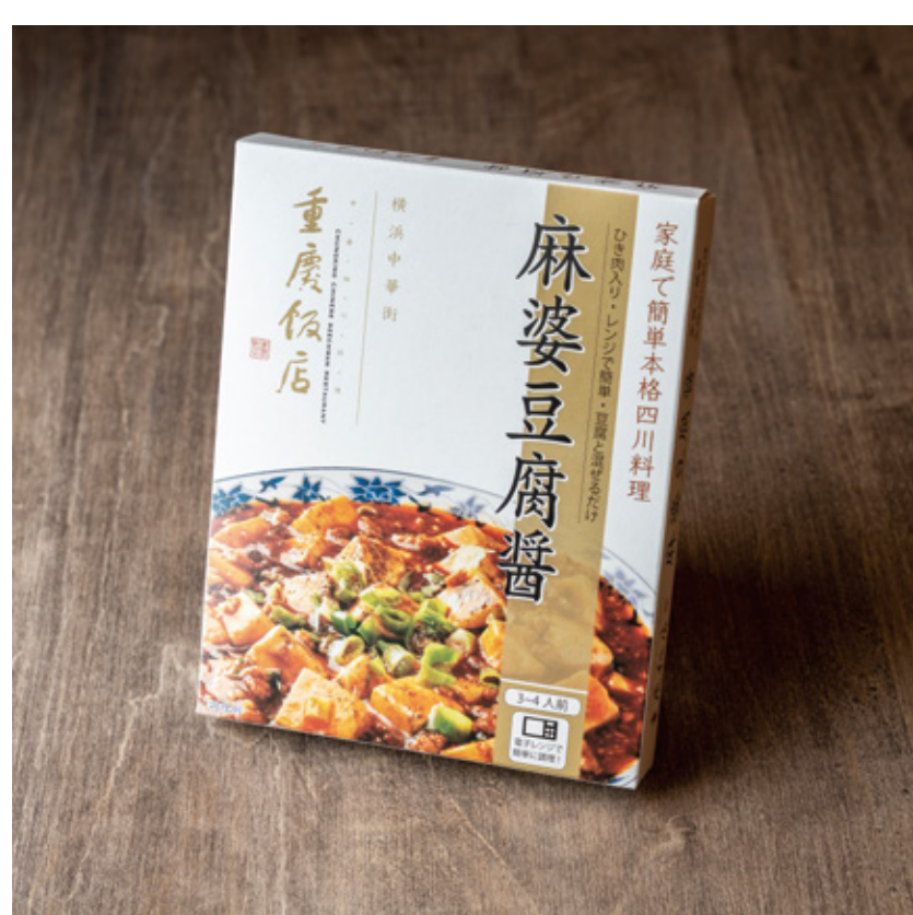
麻婆豆腐醬(商品) 486円(税込)