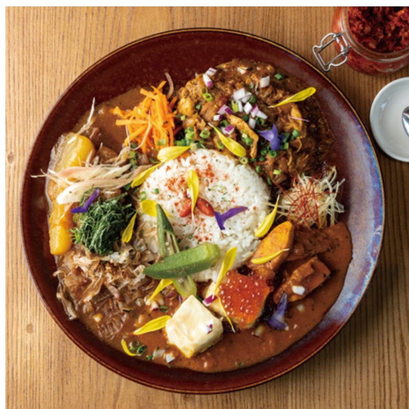
スパイスカレー 1,100円(税込)~ ※各日なくなり次第終了