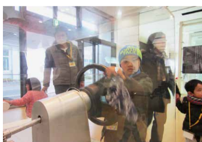
ハンドルをまわすときの機械もうごく!