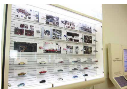
日産の歴史がわかるミニカー