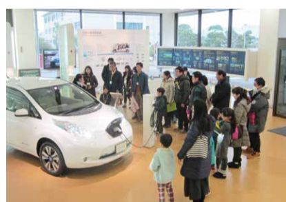
最新の電気自動車