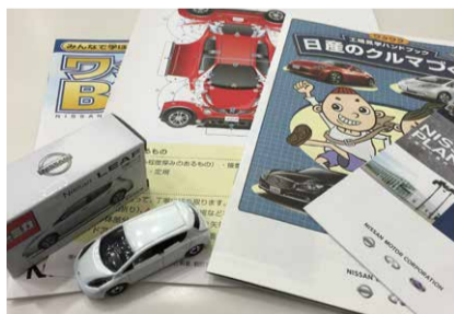
おみやげはリーフのミニカー (おみやげは変更になることがあります)