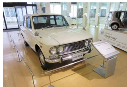
とってもめずらしい昔の車も!!