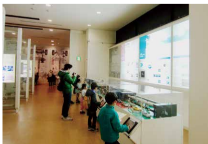
うごくミニチュア工場!