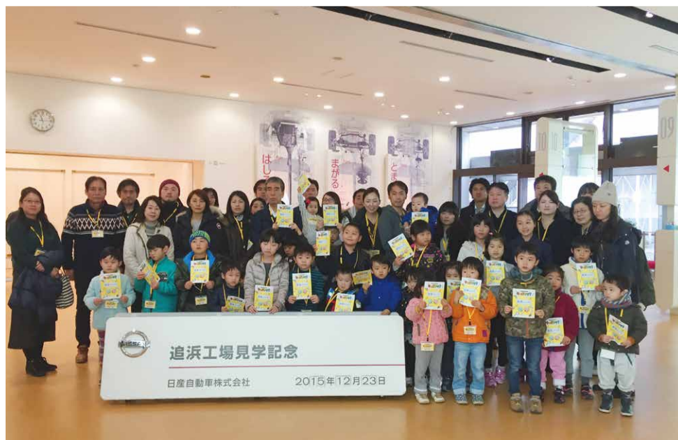
追浜工場見学記念