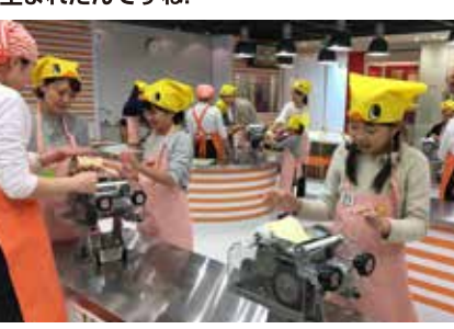
小麦粉から麺へと形になり、達成感もいっぱい!楽しい雰囲気体験できました!