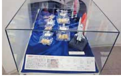
宇宙食ラーメンも展示されていました。宇宙でラーメンが食べられるなんて凄いですね!