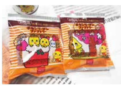
世界にひとつのチキンラーメンが完成★食べるのが勿体無いですね...!