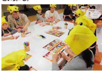
めんを蒸している間はパッケージにオリジナルのイラストを描きました。どんなひよこちゃんにしようかな～♡