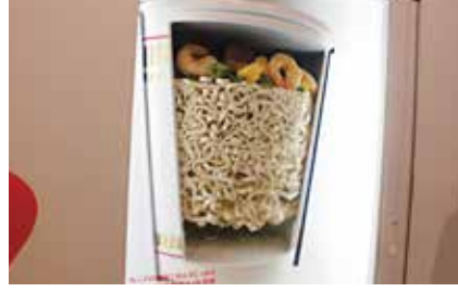
カップヌードルの断面の模型も展示されています。底が空洞になっているなんて知らなかった!という声も。