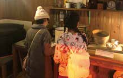
チキンラーメンが開発された1958年当時の小屋の再現。世界初の発明はここ池田市から生まれたんですね!