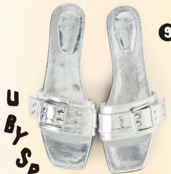
U BY SPICK & SPAN