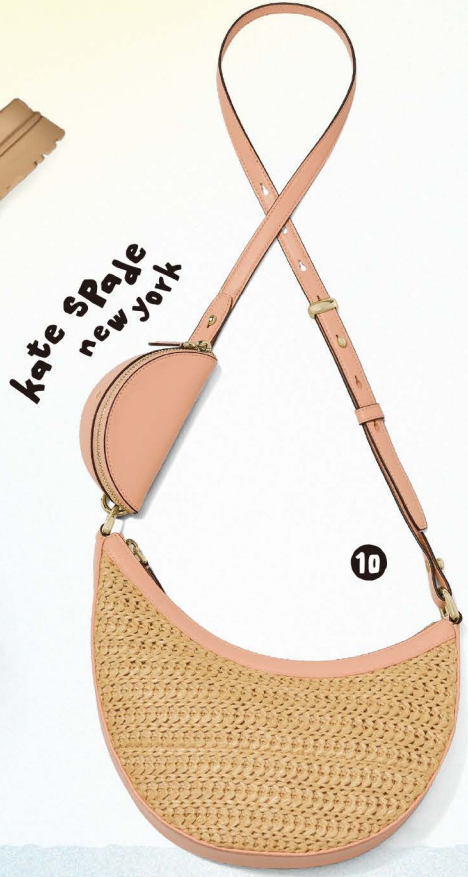
kate spade new york