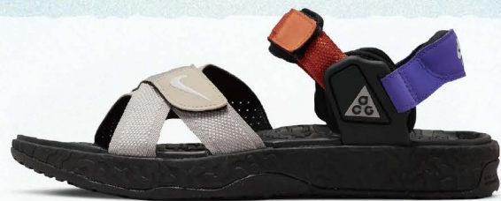
ABC-MART GRAND STAGE