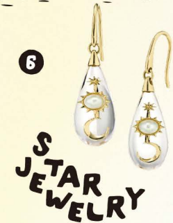
6 STAR JEWELRY