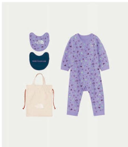
ベビーロングスリーブ ロンパース&2Pビブ ¥8,800 (税込)

定番のオーバーオールを柔らかく肌触りの良い素材にアップデート。ショルダールベルトもサイズ調整可能なため、長く着用が可能。 カラー:全3色 販売予定/2024年8月上旬以降