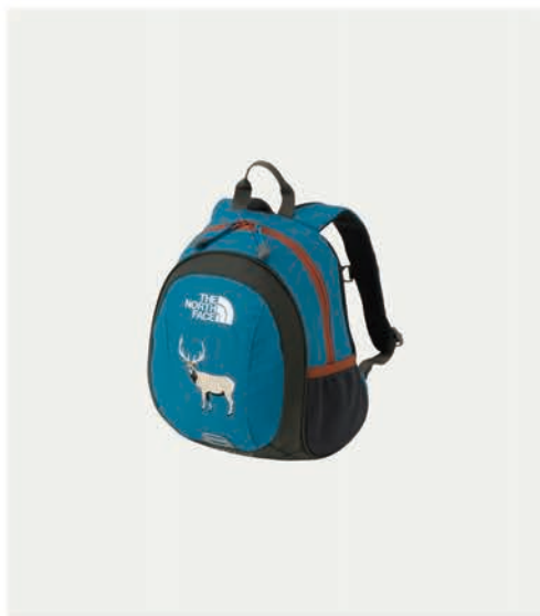
キッズホームスライス ¥8,030 (税込)

行動範囲が広がるキッズたちが初めて持つバッグとしておススメのサイズ感。動物の刺繍が人気の定番バッグの新作。 カラー:全4色