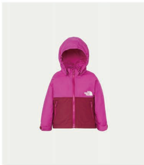
ベビーコンパクトジャケット ¥8,800 (税込)

行動範囲が広がるキッズたちが初めて持つバッグとしておススメのサイズ感。動物の刺繍が人気の定番バッグの新作。 カラー:全4色