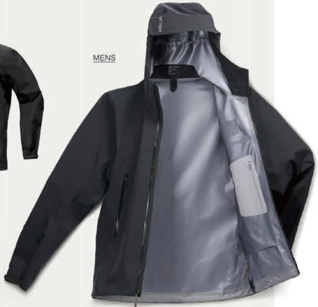
Beta Jacket M ¥68,200 (税込)

使用し、丈夫で高い汎用性をもつ最も着回しの利くシェルジャケット。 カラー:全5色