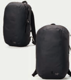
Granville-16-Backpack ¥34,100 (税込)

防水素材であるN400r-AC 2 を使用した、優れた耐候性と抜群の耐久性を誇る。荷物が出しやすい16Lのデイバック。 カラー:全3色