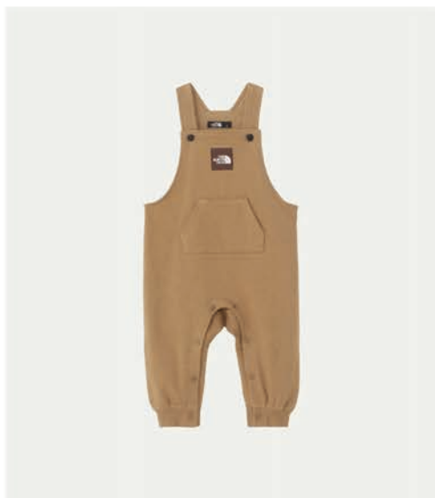
ベビースウェットロゴ オーバーオール ¥9,350 (税込)

撥水軽量の定番ウインドブレーカー。フードは取り外し可能なデザインでUVケアも。洗濯などイージーケアのため思う存分外遊びが可能。 カラー:全4色 販売予定/2024年8月上旬以降