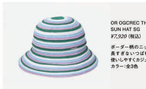
OR OGCREC THERMO SUN HAT SG ¥7,920 (税込)

国内外のブランドやこだわりのオリジナルアイテム、異業種とのコラボレーションなどを取り扱う帽子のセレクトショップ。性別や年齢に捉われることなく、その人、その時代に合わせた帽子をご提案。