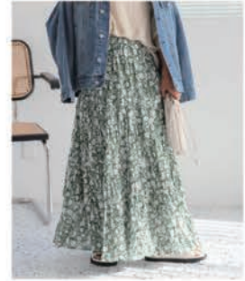
コットンポイルクリンクル ティアードスカート ¥8,800 (税込)

風合いの良いコットンポイル素材にしわ加工が施された柔らかな表情が魅力的。トレンドの程よいボリューム感のあるシルエットに仕上げた。