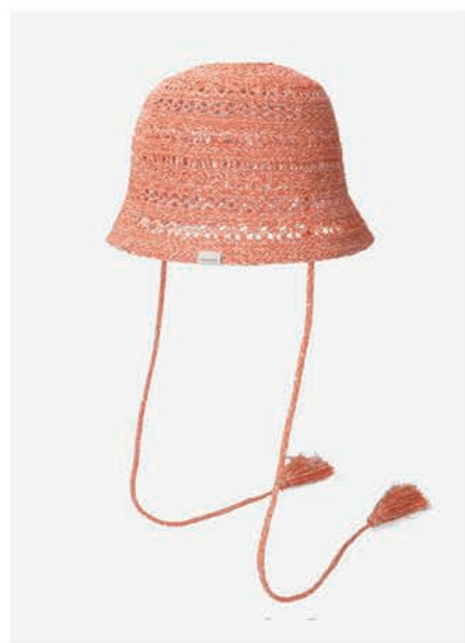
OR THERMO JP LACE TULIP ¥7,920 (税込)

ボーダー柄のニットサンハット。長すぎないつば幅なので日常使いしやすくカジュアルに被れる。 カラー:全3色