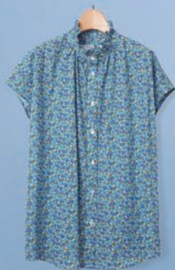
フリルデザインシャツ ¥10,780 (税込)

に機嫌よく過ごさせてくれるはず。 ポジティブになりたい日は、オフのお気に 入りを着こなしに取り入れて。花束みた いなブルーのデザインシャツ。シルエッ トにこだわった華やかなテーパードスラ ックス。遊び心が加わって、すどんと肩の 力が抜ける。さあ、涼やかに笑って、今年 の夏も乗り越えよう。