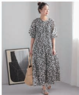
コットンポイルクリンクル シャーリングワンピース ¥11,000 (税込)

relumeは「ちょうどよい」大人のファッションを提案するブランド。 カジュアルでベーシックだけど品質にはこだわったアイテムと、 ちょっと先を行くトレンドを独自に解釈したアイテムを提案する。