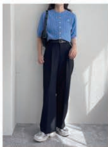
FR刺繍ケーブル柄 半袖カーディガン ¥7,920 (税込)

毎年人気のケーブル柄半袖カー ディガン。コンパクトなサイズ感 が可愛い1枚。 カラー：全4色 販売予定 / 2024年4月上旬