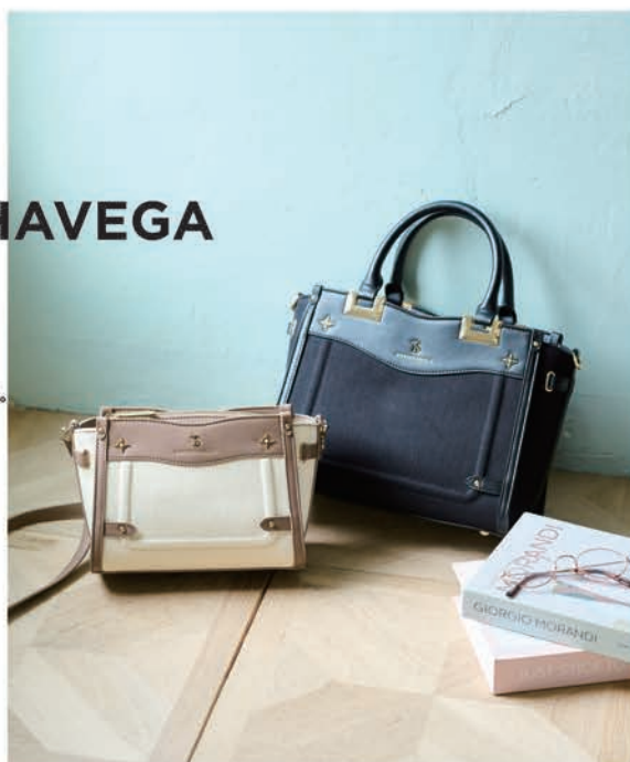
サイドビジュールキャンパスバッグ 小 ¥17,600 (税込) 大 ¥19,800 (税込)

「GIRL, Lady It's me」 CUTEな私も私。COOLな私も私。 今しかないこの時を 自分らしく全力で。 サマンサベガと一緒に。