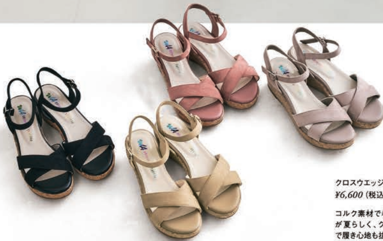
クロスウエッジサンダル ¥6,600 (税込)

コルク素材で巻いたウエッジソール が夏らしく、クッション入りのベルト で履き心地も抜群。 カラー:全4色