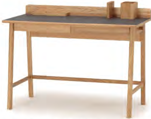
THEO デスク リノリウム/木材 ¥94,600 (税込)

机には備え付けのペントレーやブックスタンドがセット。タブレット用のスリットやブックスタンドなど、デスクまわりに必要なアイテムが備わった機能的なデスク。リモート学習が増えたお子様向けにはもちろん、スマートなデザインはリビングやダイニングに置くワークデスクとしてもおすすめ。