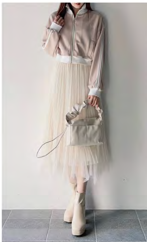
チュールスカート ¥5,390 (税込)

チュール×イレギュラーヘムが華やかなチュールスカート。裾に並んだバルが上品さを演出。 カラー:全2色