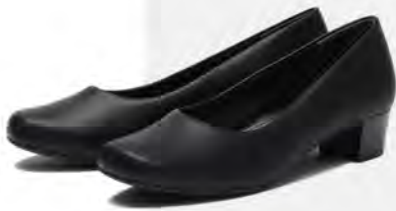
ブレーン パンプス 3.5 W5008 ¥5,940 (税込)

ABC-MARTがおススメするお仕事Fitパンプス。アーチサポートとつま先の窮屈感を軽減したオリジナルクッションで、履きやすさ◎ ABC-MART プレミアステージ: Plaza West 3F tel. 044-520-3720