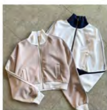
トラックジャケット ¥5,390 (税込)

スポーティーなデザインがトレンド感たっぷり。24SSカレッジコレクションの一押しアイテム。 カラー:全4色