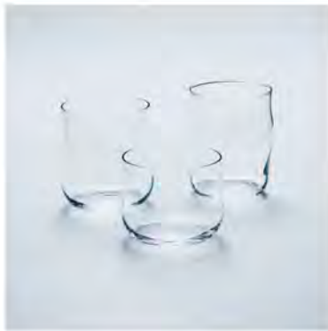
HIBITO(ヒビト) GLASS 各 ¥1,100 (税込)

それぞれに名前があるものの、どれをどのように使うかは自由。口に触れた時に心地よい薄さでありながら、不安感のない適度な厚みをもたせ、心地よさと安心感を備えたグラス。