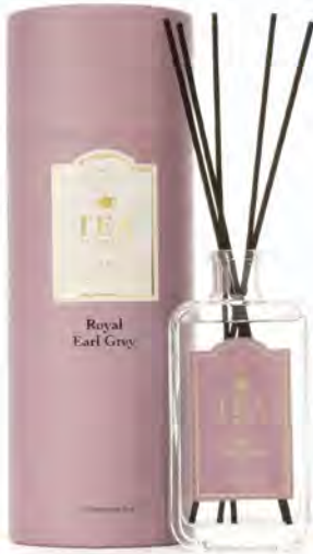
ディフューザー (ロイヤルアールグレイの香り) ¥3,960 (税込)

フルーツやハーブの上品な香りが広がるディフューザー。 Afternoon Tea LIVING: Plaza West 2F tel. 044-874-8235