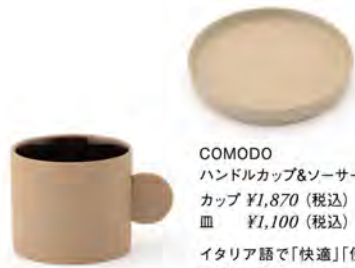
COMODO ハンドルカップ&ソーサー カップ ¥1,870 (税込) 皿 ¥1,100 (税込)

イタリア語で「快適」「便利」を意味する「COMODO(コモド)」シリーズ。取っ手付きのハンドルカップ、ソーサーや取り皿になるプレートはぜひセットで使いたい。カラー:全2色