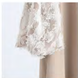
袖ジャガードワンピース ¥12,980 (税込)

袖にジャガード素材を使用した、透け感のある バルーンスリーブが特徴的でフェミニンな ワンピース。 カラー:全2色