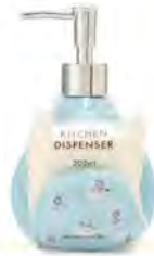
フルールリオン 陶磁器ディスペンサー ¥2,200 (税込)

リラックスできる香りや、仕事のスイッチを入れてくれる香り。心や気持ちを上手に整えるためにも、部屋に香りを取り入れてみませんか？不慣れな新生活で無意識のうちに蓄積している疲れも、香りがもたらす癒しの効果でリフレッシュ。寝室や玄関など、スポットでお気に入りの香りのディフューザーを置いたり、纏いたい香りのハンドクリームをバッグに忍ばせるだけでも気分が変わるはず。まずは自分が惹かれる香りを探してみてください。