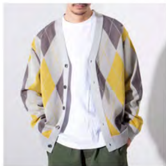
ハイツイストアーガイル Vネックカーディガン ¥9,350 (税込)

クロップド丈がトレンド感満載の定番デニムジャケット。スタイルアップ効果があり、チノパンやデニムパンツと合わせたトラッドなスタイルやワンピースに羽織ったレディライクな合わせなど、様々なコーディネートで活躍するアイテム。デニム素材でありながら柔らかな着心地で、楽に着用できるのもポイント。カラー:全2色