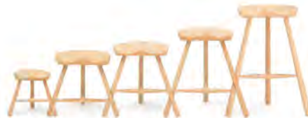
SHOEMAKER STOOL 高さ 27cm ¥29,700 (税込) 42cm ¥31,900 (税込) 49cm ¥33,000 (税込) 59cm ¥41,800 (税込) 69cm ¥47,300 (税込)

それぞれに名前があるものの、どれをどのように使うかは自由。口に触れた時に心地よい薄さでありながら、不安感のない適度な厚みをもたせ、心地よさと安心感を備えたグラス。