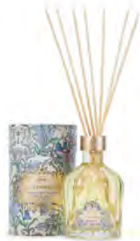
アロマ ジャスミン&ヒヤシンス ¥7,480 (税込)

Afternoon Tea LIVING: Plaza West 2F tel. 044-874-8235