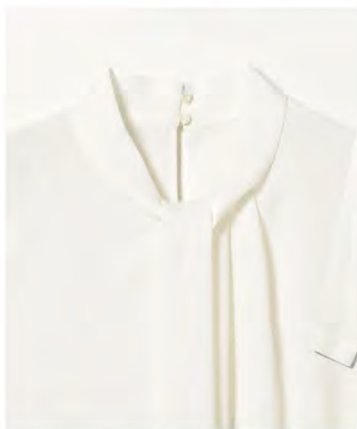
ジョーセット ボウタイ ブラウス ¥7,920 (税込)

幅広い世代向け、 メンズ&ウィメンズのカジュアルからビジネス、 更にキッズ&ベビーや雑貨まで 多彩なラインナップで、 現代のファッションとライフスタイルを提案。