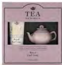
ハンド&ネイルセラム・マルチ バームセット (ロイヤルアールグレイの香り) ¥1,980 (税込)

フルーツやハーブの上品な香りが広がるディフューザー。 Afternoon Tea LIVING: Plaza West 2F tel. 044-874-8235