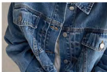
クロップド丈デニムジャケット ¥11,880 (税込)

クロップド丈がトレンド感満載の定番デニムジャケット。スタイルアップ効果があり、チノパンやデニムパンツと合わせたトラッドなスタイルやワンピースに羽織ったレディライクな合わせなど、様々なコーディネートで活躍するアイテム。デニム素材でありながら柔らかな着心地で、楽に着用できるのもポイント。カラー:全2色