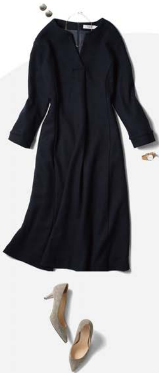
スムーズールワンピース ¥23,100 (税込)

ウエストの控えめなシェイプラインがスタイルを美しく見せてくれるワンピース。パールや大振りのアクセサリーを合わせて、オケージョンのみならず様々なシーンで活躍。