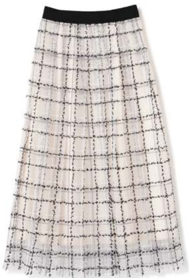
シアチェック クロップドブラウス/スカート 各¥15,290(税込)

ツイード調に仕上げたオリジナル のシアチェック素材のクロッ プドブラウスとスカート。セット アップとして着用も可能。 カラー:全2色 販売予定/2024年2月中旬