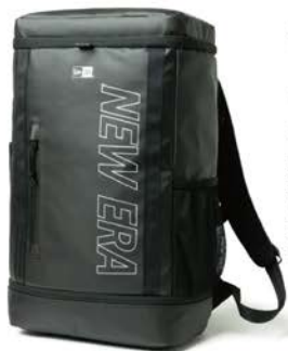
ボックスバック 32L TPU プリントロゴ アウトライン ブラック × リフレクトシルバー ¥13,200(税込)

1920年、アメリカのニューヨーク州バッファローで創業した「ニューエラ」は、メジャーリーグ・ベースボール(MLB)唯一の公式選手用キャップサプライヤー。近年ではバッグやアパレルなども豊富に展開。