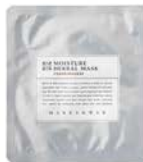
モイスタチャーハーバルマスク 限定フランキンセンス1枚入り ¥360 (税込)

肌のキメを整え、透明感のある素肌へと導く 美容液。 販売予定/2024年2月29日(木)まで ※在庫状況により前後します。