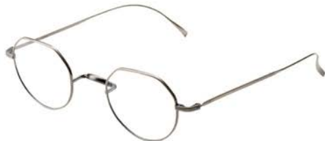
KC-21R BK ¥41,800 (税込) ※レンズ代別

昭和33年(1958)に 眼鏡産地・福井県鯖江市に創業。 上質な日本製アイウェアを揃える。