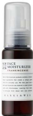
ハーバルモイスタチャライザー 限定フランキンセンス 50ml ¥3,000 (税込)

2000年に東京で生まれたデイリープロダクトのブランド。 年齢や性別に関わらず暮らしを楽しみたい方へ向けて、植物の恵みを生かした フェイスクア・ボディケア・ヘアケアをメインに、天然精油の芳香浴アイテム、オーガニックコットンタオルや 天然木のグッズなど、ライフスタイル雑貨も展開。各種ギフトにもおすすめ。