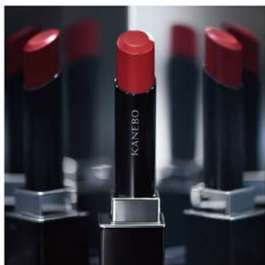
カネボウ ルージュスターヴァイブランス ¥4,620 (税込)

KANEBOより新リップが登場。その人の唇になり代わり、時間が経っても生き生きとした表情が続く。 カラー:全12色 ※無くなり次第終了