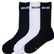
ソックス クルー 3ペア マルチ ¥1,320(税込)

ボックス型のシルエットが特徴的なボックスバックは、その構造から余分な隙間を生まず効率的な収納が可能。タウンユースから通勤・通学まで幅広くニーズを満たす使い勝手の良さで支持を集める。滑らかな光沢感と対候性が特徴のTPU加工を施したモデル。