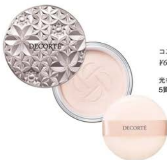
コスメドルセルテースパウダー ¥6,050 (税込)

関東有数の品揃えと無料肌測定などの“キレイのサービス”が 魅力的な化粧品専門店。 あなたの『キレイになりたい』を全力でサポート。