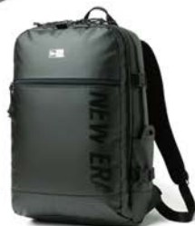
スマートバック 28L プリントロゴ TPU ブラック × ブラック ¥13,200(税込)

ニューエラが展開するバックパックの中で中型サイズに位置づけられるスマートバック。スクエア型のシルエットを活かし、有効的に収納スペースを確保したモデルで、幅広いユーザーに適したデザイン。滑らかな光沢感と対候性が特徴のTPU加工を施したモデル。