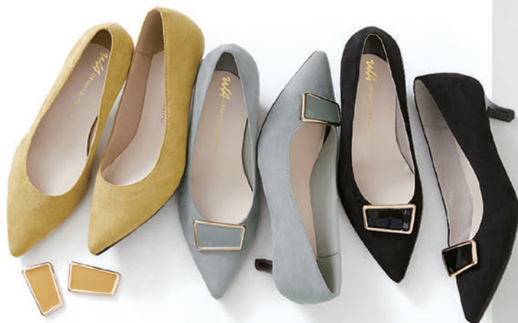
2wayスクエアモチーフ ヒールパンプス ¥7,500 (税込)

細身のヒールが女性らしく、つま先にクッションが入っているので指先に負担がかかりにくい。