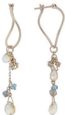
左) K10YG シトリン・ブルートパース・ ラブラドライト ピアス ¥44,000 (税込)