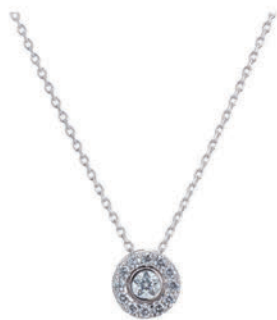
K18WG "Wish upon a star"® ダイヤモンド ネックレス ¥165,000 (税込)~

気軽に楽しめる耳周りのアイテムは、秋冬のカラーストーンを加えてみたり、 つけ方ひとつで印象が変わるので、いくつ持ってもコーディネート の楽しみが広がる。