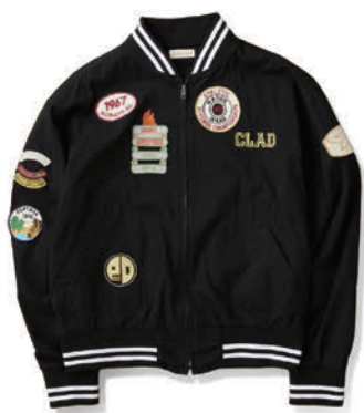
[SPORTCLAD / スポーツクラッド] 別注 ワッペンブルゾン ¥18,700 (税込)

relumeは「ちょうどよい」大人のファッションを提案するブランド。 カジュアルでベーシックだけど品質にはこだわったアイテムと、 ちょっと先を行くトレンドを独自に解釈したアイテムを提案する。