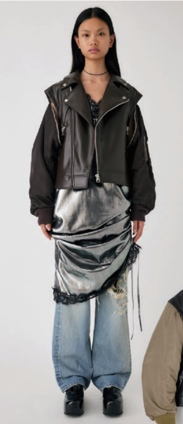
FAUX LEATHER DETACHABLE JACKET ¥22,990 (税込)

Denim/Standard/Vintage/Culture 4つのキーワードで、人それぞれの「芯」を際立たせるスタイルを提案するMOUSSY。それに加え、MOUSSY+ではバロックジャパンリミテッドが展開するブランドの一部アイテムをセレクトし、店内に様々なエッセンスを“プラス”することで、幅広く充実したアイテムラインナップを届ける。