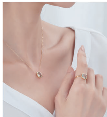
K18YG グリーンアメシスト ネックレス 上) ¥77,000 (税込) K18YG グリーンアメシスト リング 下) ¥88,000 (税込)

静かにたゆたう水面のように、やわらかにカラーストーンがきらめくシリーズ。 「水面のようなきらめきが身に着ける人の日常をより一層輝かせてくれますように…」 という想いが込められたデザインは、その瑞々しい艶めきが美しい自然 の風景を思い起こさせる。透明感のある佇まいは、存在感がありながらも軽やかな 印象を与えてくれ、ミニマルで洗練されたフォルムは、ストーンの輝きを最大限に 引き立てる仕立てに。ストーンはすべてオーダーで1点1点カットしており、上質な クラフトマンシップが宿る。