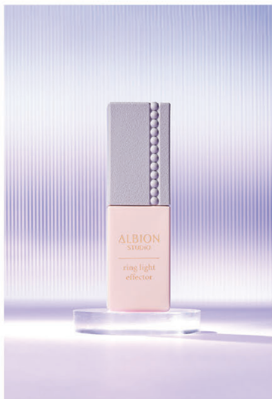
アルビオンスタジオ リングライトエフェクター ¥3,850 (税込)

関東有数の品揃えと無料肌測定などの “キレイのサービス”が魅力的な化粧品専門店。 あなたの『キレイになりたい』を全力でサポート。