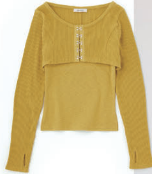
HOOK & EYE BOLERO TOP ¥8,470 (税込)

ボレロとタンクトップがセットになったマルチウェイアイテム。フロントのホック使いがトレンド感のある印象に◎フィットシルエットなので、どんなシルエットのボトムにも合う、着回しの利くアイテム。 販売予定 / 2023年9月中旬