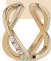
右) SV925 キュービック イヤーカフ ¥6,600 (税込)

気軽に楽しめる耳周りのアイテムは、秋冬のカラーストーンを加えてみたり、 つけ方ひとつで印象が変わるので、いくつ持ってもコーディネート の楽しみが広がる。