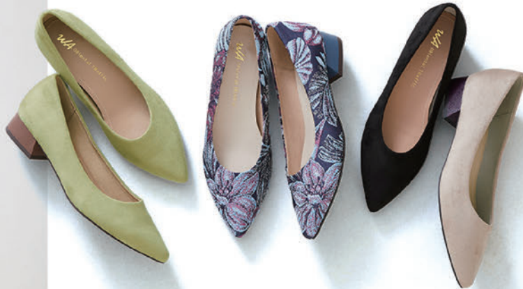
バイカラー ポイントトゥパンプス ¥6,500 (税込)

シンプルなフォルムながら、アッパーと異なるカラーの台形ヒールが存在感抜群のパンプス。