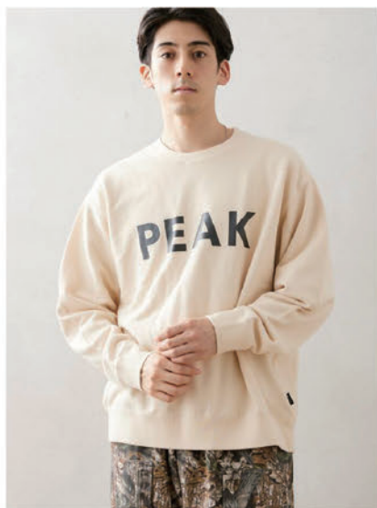
[SNOW PEAK / スノーピーク] 別注 クルーネック スウェット "PEAK" ¥14,300 (税込)

SNOW PEAK定番人気「再帰反射ロゴTシャツ」のデザインをベースにした、relumeだけの特別なクルーネックスウェット。サイズ感はインラインの商品よりもトレンド感のあるオーバーシルエットにアップデート。 販売予定 / 2023年9月中旬