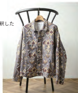
CALIFORNIA プリントコーデロイ トラッカージャケット ¥16,500 (税込)

relumeは「ちょうどよい」 大人のファッションを提案するブランド。 カジュアルでベーシックだけど 品質にはこだわったアイテムと、 ちょっと先を行くトレンドを独自に解釈した アイテムを提案する。