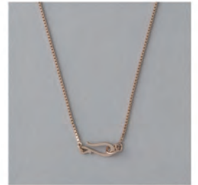
“Raw”ネックレス ¥16,500 (税込)

あたたかみのあるオリジナルカラー “ロウブラウンゴールド”。1本ではもちろん、 レイヤードスタイルも楽しめます。