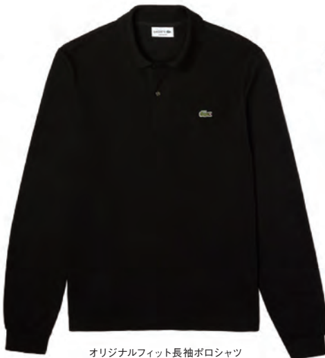
オリジナルフィット長袖ポロシャツ L1312LJ-99 ¥17,600 (税込)