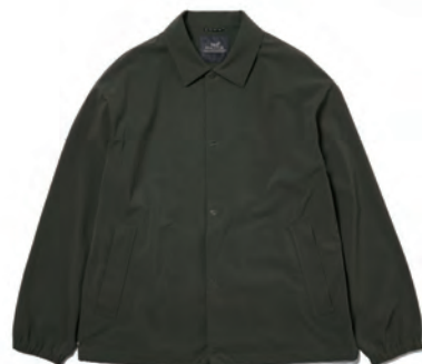
360° マスター リラックス コーチジャケット ¥22,000 (税込)

90'Sムード溢れるバルーンシルエットのアーガイル柄ニットポロ。コットンにアクリルをブレンドしたしなやかな素材感に加え、程よい光沢が上品な印象を与えてくれる。 販売予定/2023年8月中旬予定