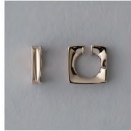
“Raw”ピアス ¥25,300 (税込)

“ジュエリーをもっと自由に楽しんでもらいたい” という想いのもと、シンプルな美しさを讃えながら、 ひとさじの遊び心を添えたジュエリーを展開。