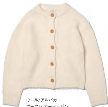
ウール/アルパカ ブーケ カーディガン ¥17,600 (税込)

ループ状の糸を使ったクルーネックカーディガン。ふわふわしたボリューム感が特徴で、一枚着としても、羽織としても着られるサイズ感で作製。 販売予定/2023年8月中旬予定