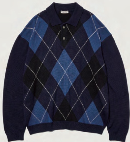
アーガイルニットポロシャツ ¥14,960 (税込)

90'Sムード溢れるバルーンシルエットのアーガイル柄ニットポロ。コットンにアクリルをブレンドしたしなやかな素材感に加え、程よい光沢が上品な印象を与えてくれる。 販売予定/2023年8月中旬予定