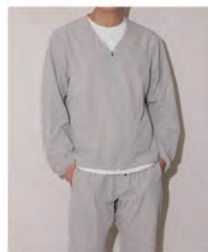
[NJ/CLUB] PARKSTOCK コンフォータブルストレッチ ジャケット&ストレートパンツ 各 ¥11,000 (税込)