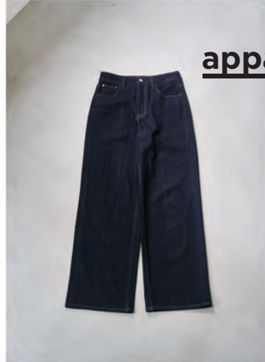
[Healthy DENIM] 別注 ワイドデニム ¥16,500 (税込)

腰周りは程よいフィット感、膝下はワイド めなストレートシルエットで美脚ライン にこだわった1本。 カラー:全2色