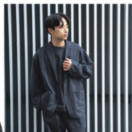
ストレッチ メッシュ 2ボタン ジャケット ¥9,900 (税込)

シャツ感覚で羽織れる軽量ジャ ケット。両サイドにやや大きめのポ ケットを配し、ちょっとした小物を 収納可能。 サイズ:S・M・L・XL カラー:BLACK・GREIGE