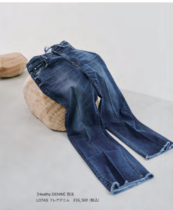
[Healthy DENIM] 別注 LOTAS フレアデニム ¥16,500 (税込)

「ジャパン・メイド・トラディショナル」 「モダン・ヴィンテージ」「シズナル・ワードローブ」3ラインと、 ブランドセレクトからなるマルチレベルストアを展開し、 生活に役立つファッションや 情報を知恵として提案することを活動とする。