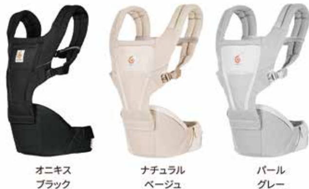
オニキス ブラック