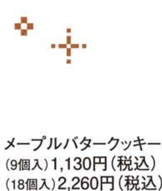
メープルバタークッキー (9個入)1,130円(税込) (18個入)2,260円(税込)