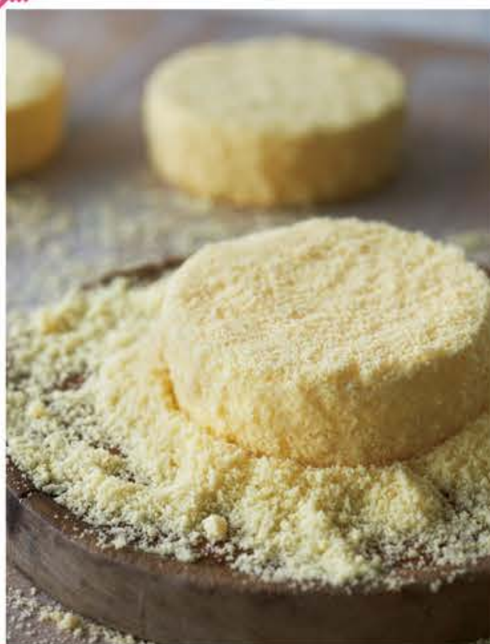
ドゥーブル フロマージュ 2,160円(税込)

東京駅、人気お土産ランキング5年連続No.1!大人気ブランドのメープルマニアが再登場!上質なメープルシロップを使ったお菓子の専門店です。今回は限定のメープルマニア缶もご用意がございます。この機会にご来店をお待ちしております。