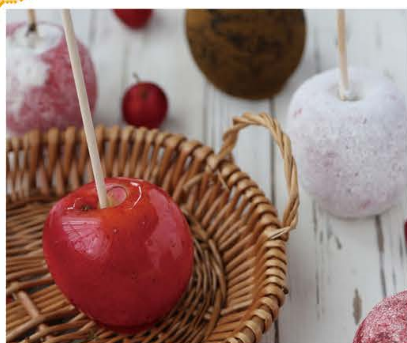
りんご飴プレーン 550円(税込)

北海道小樽から「小樽洋菓子舗ルタオ」が期間限定出店!1番人気のチーズケーキ「ドゥーブルフロマージュ」をはじめ、チョコレートや焼き菓子など数多くの商品をご用意しております。14日間の期間限定ですので、是非お立ち寄り下さい!