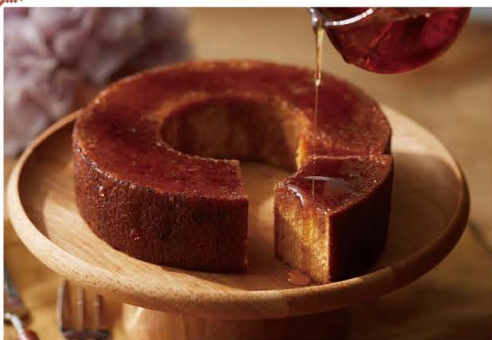
メープルバウムクーヘン 2,376円(税込)