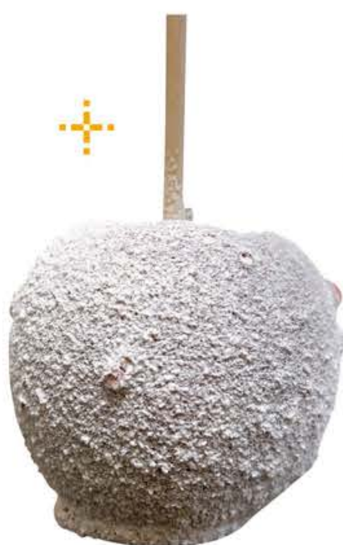
ホワイトチョコ 600円(税込)