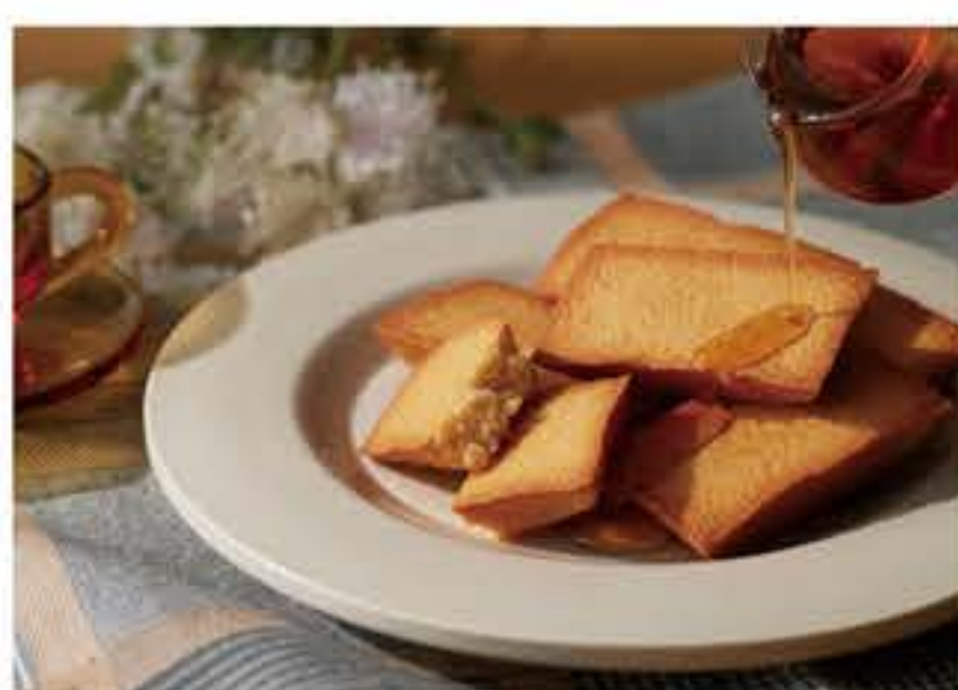
メープルフィナンシェ (6個入) 1,300円(税込)