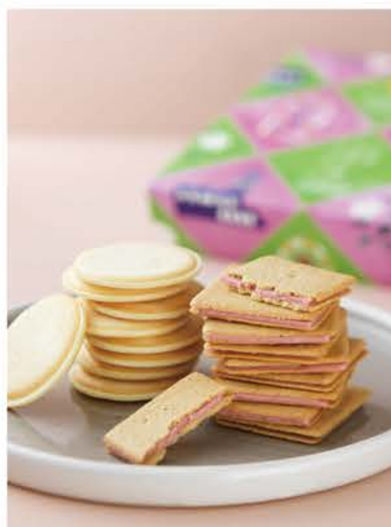
ラングドシャアソート (20枚入) 2,268円(税込)