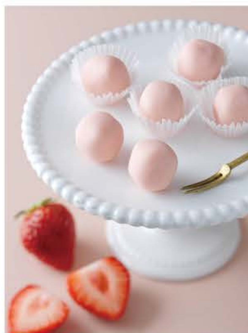
レアチョコレート いちごミルク 972円(税込)