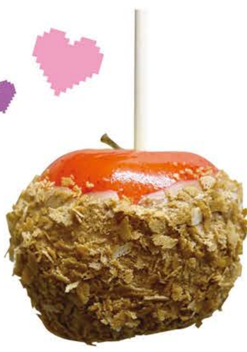
アップルパイ風りんご飴 730円(税込)