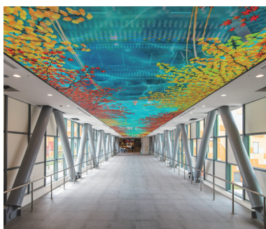
接続ブリッジの天井大型LEDパネル

南館メインエントランスの上段には、外壁と一体化したシースルーLEDパネルを採用し、南館の外壁をモチーフにした映像や館内店舗の広告等をご覧ください。