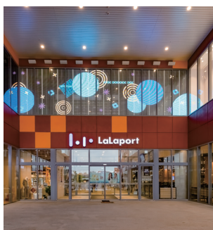
南館エントランス