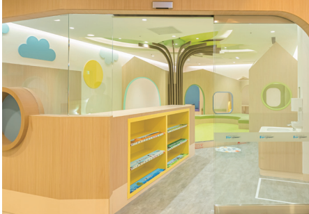
親子で休憩可能な児童休憩室「ららkids」(北館3階)