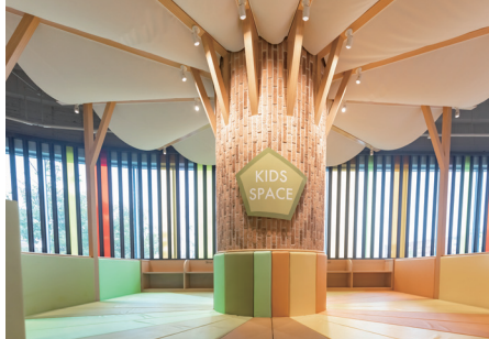
フードコート内キッズスペース(南館)