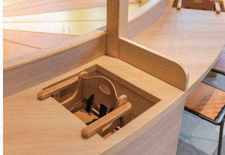
お子様専用固定椅子