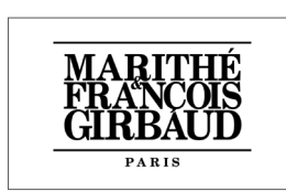
「MARITHÉ FRANÇOIS GIRBAUD」