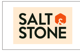
「SALT & STONE」