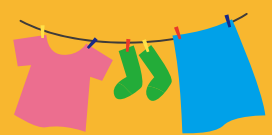
せんたくものほし