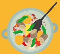
りょうりのてっだい