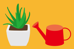
しよくぶつのみずやり