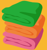
せんたくものをたたむ