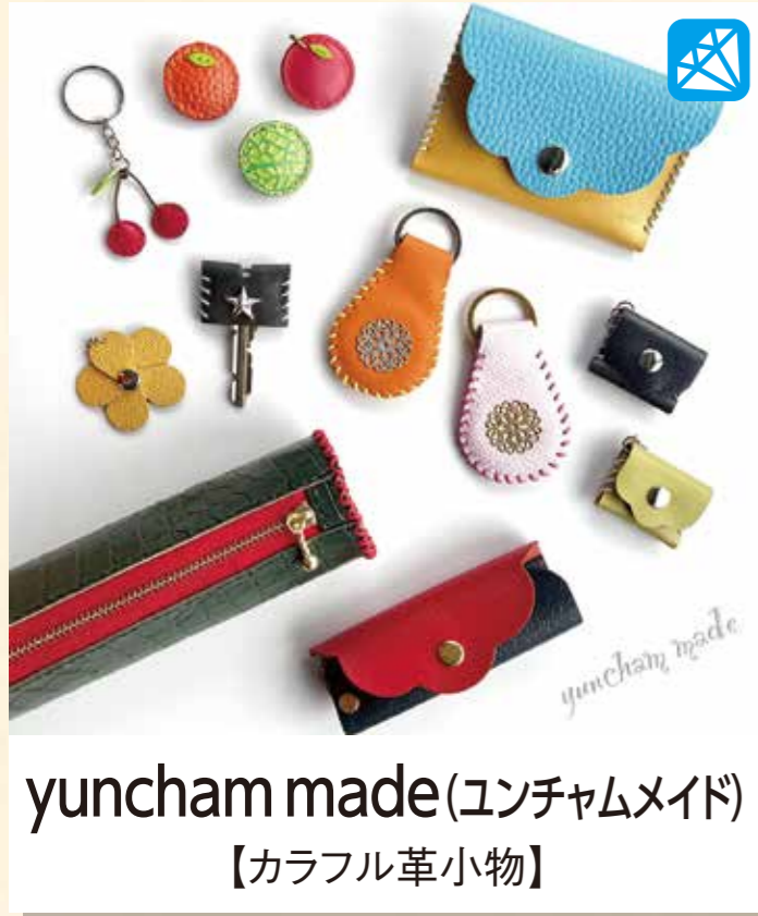
yuncham made(エンチャムメイド) 【カラフル革小物】