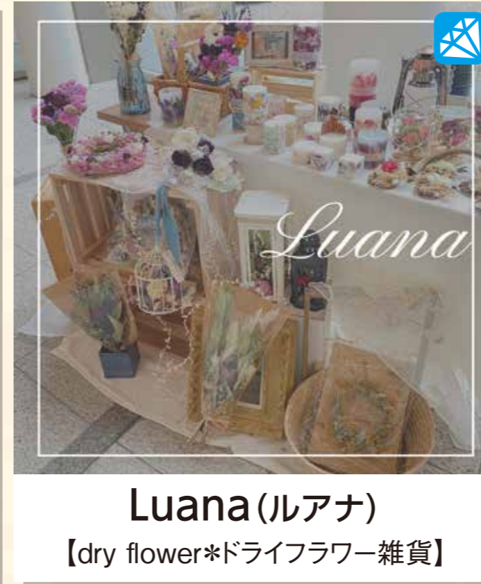
Luana(ルアナ) 【dry flower*ドライフラワー雑貨】