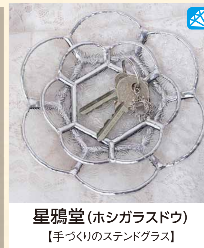
星鴉堂(ホシガラスドウ) 【手づくりのスタンドグラス】