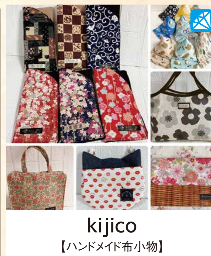
kijico 【ハンドメイド布小物】