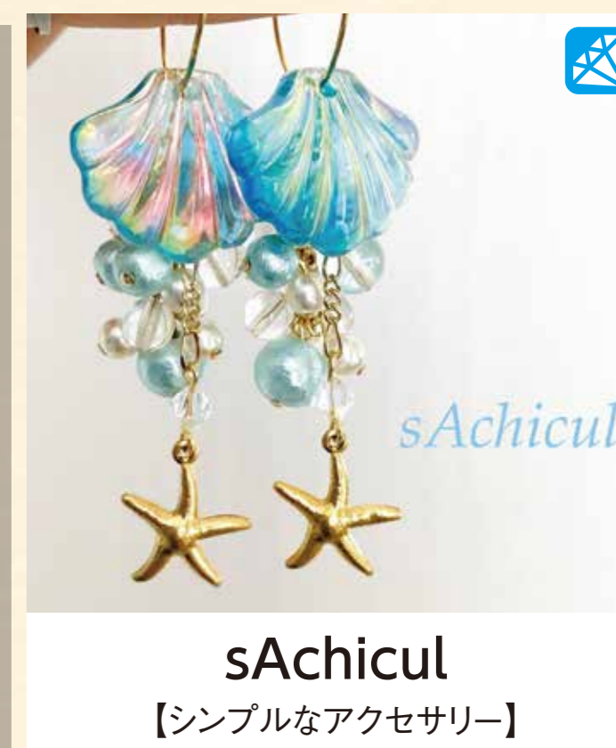
sAchicul 【シンプルなアクセサリ】