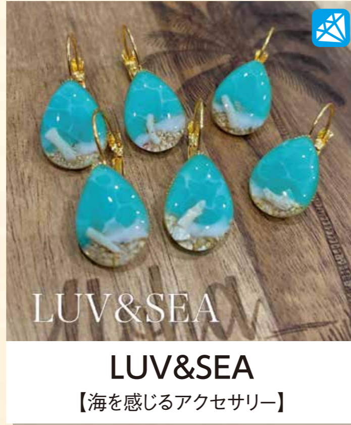
LUV&SEA 【海を感じるアクセサリ】