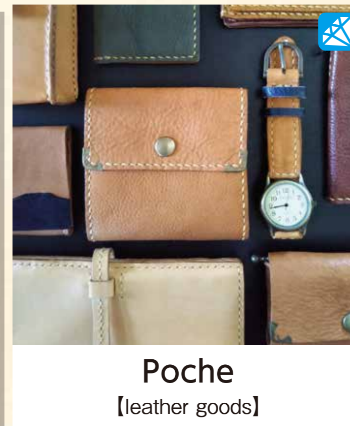
Poche 【leather goods】