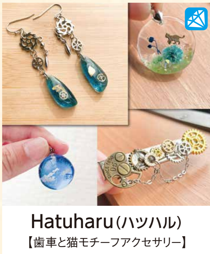
Hatuharu(ハツハル) 【歯車と猫モチーフアクセサリ】