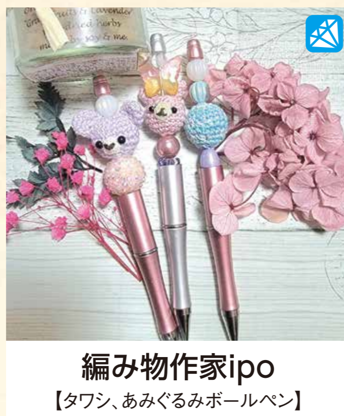
編み物作家ipo 【タワシ、あみぐるみボールペン】