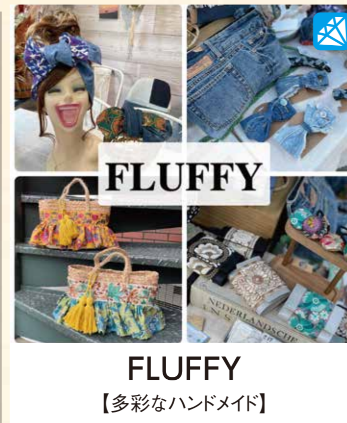
FLUFFY 【多彩なハンドメイド】