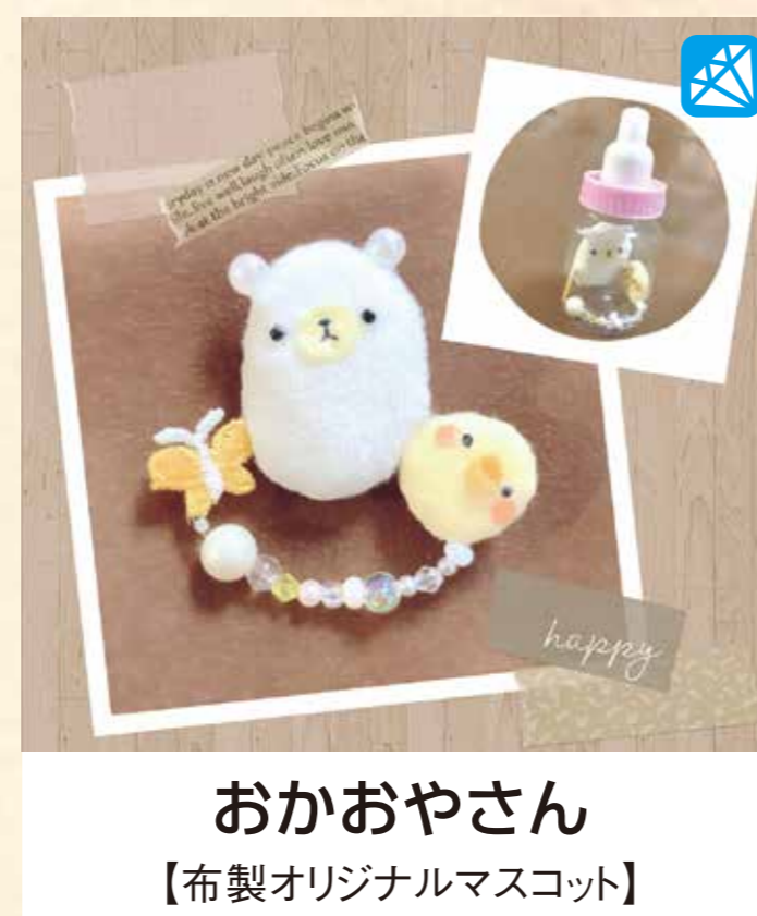
おかおやさん 【布製オリジナルマスコット】