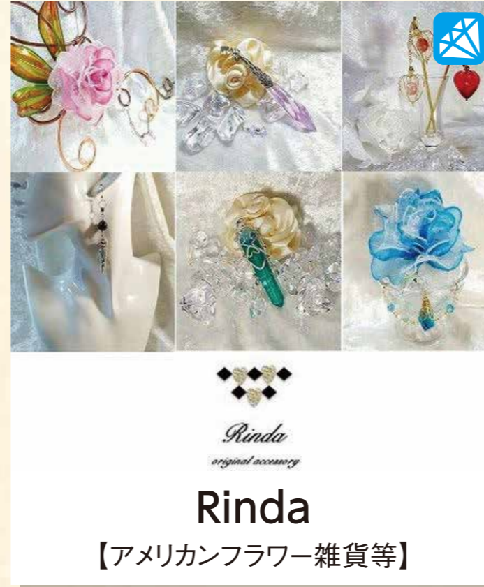
Rinda 【アメリカンフラワー雑貨等】