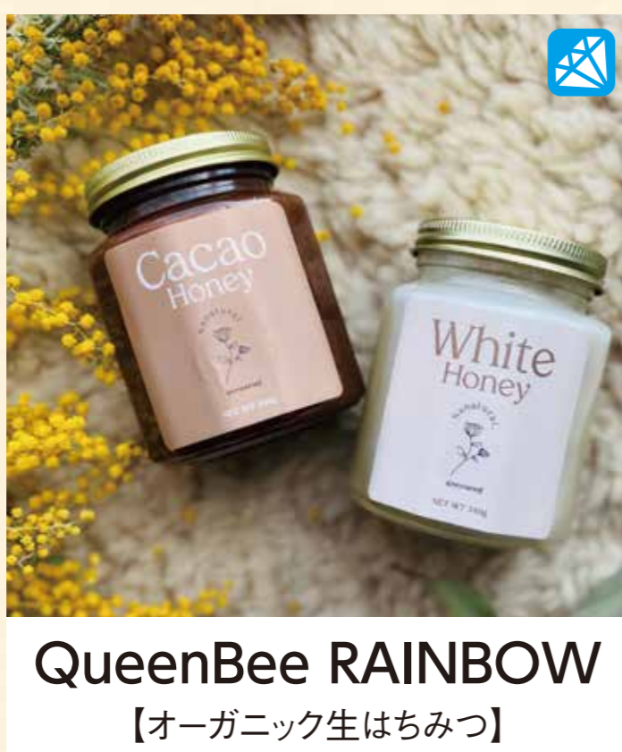
QueenBee RAINBOW 【オーガニック生はちみつ】