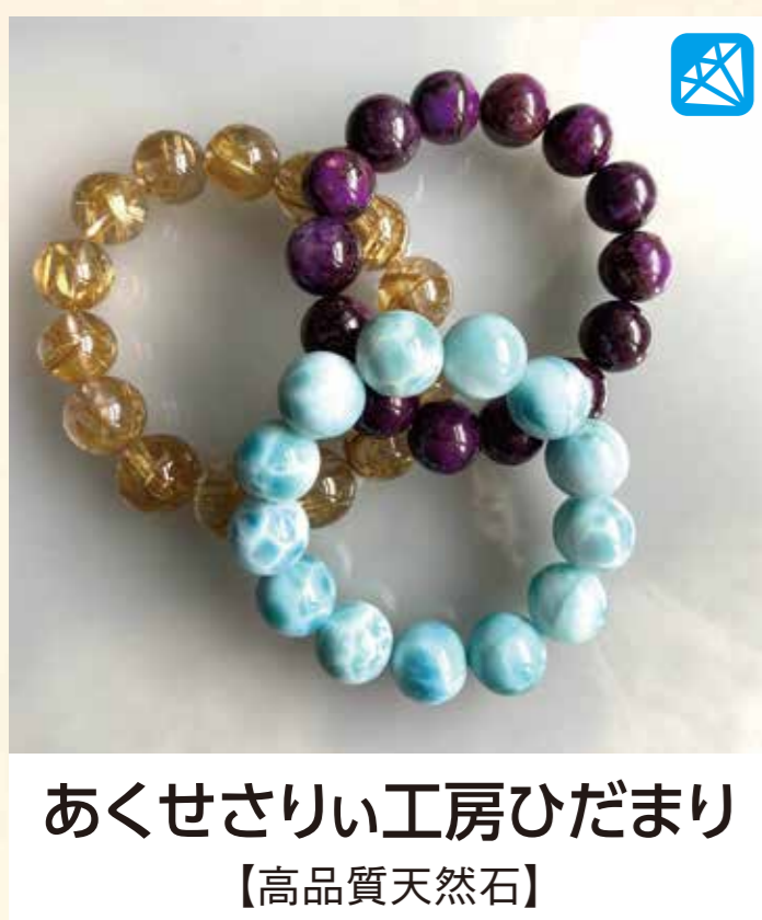
あくせさり工房ひだまり 【高品質天然石】