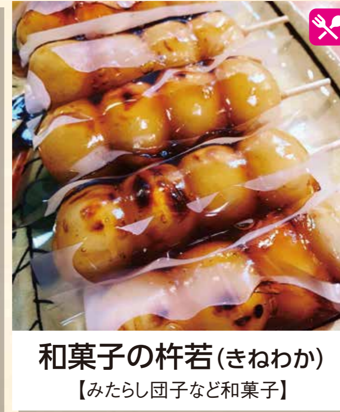
和菓子の杵若(きねわか) 【みたらし団子など和菓子】