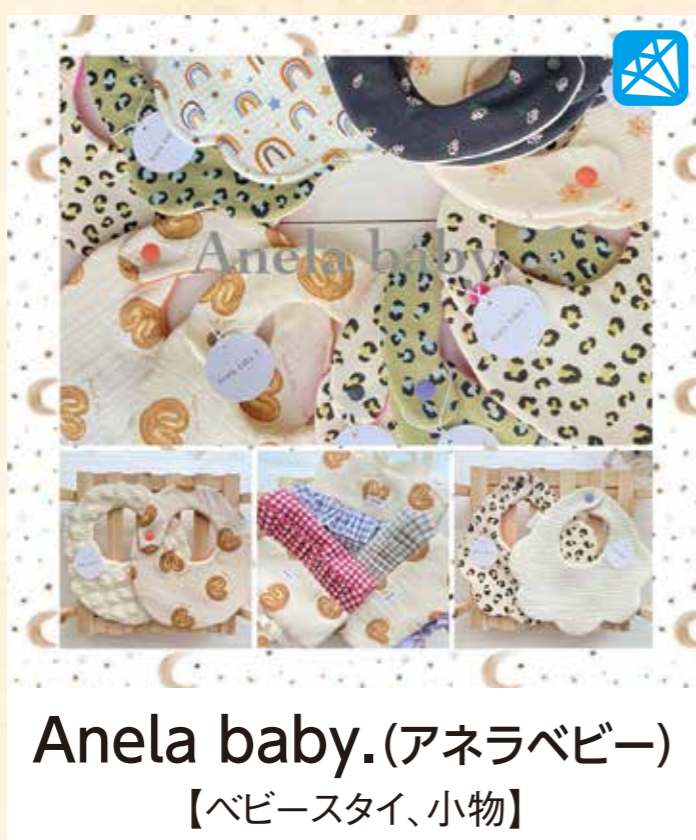
Anela baby.(アネラベビー) 【ベビースタイ、小物】