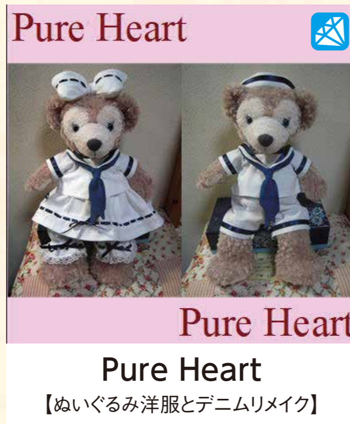
Pure Heart 【ぬいぐるみ洋服とデニムリメイク】