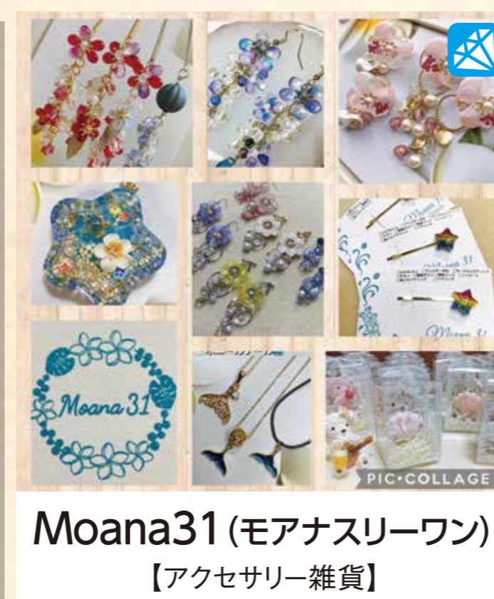
Moana31(モアナスリーワン) 【アクセサリ・雑貨】