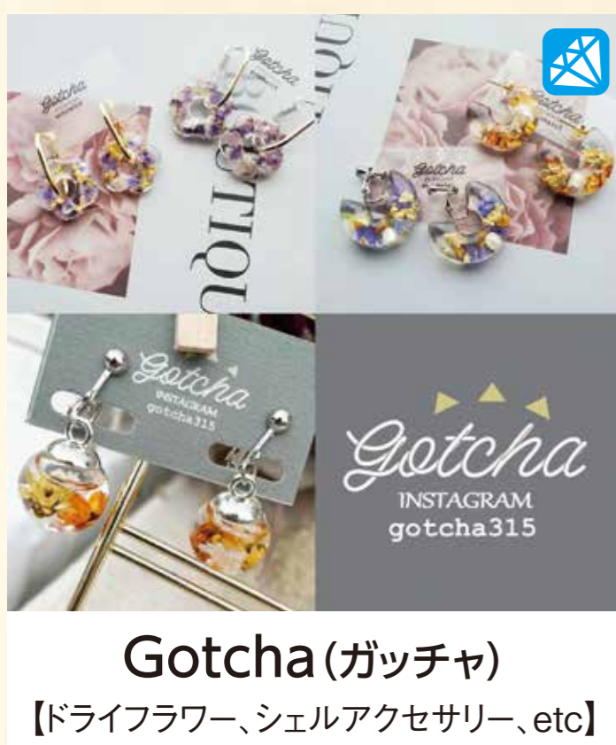
Gotcha(ガッチャ) 【ドライフラワー、シェルアクセサリ、etc】