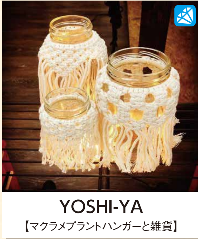
YOSHI-YA 【マクラメプラントハンガーと雑貨】