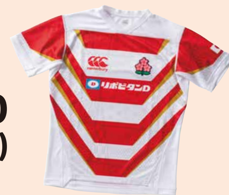
※ジャパンレプリカホームジャージ VCR39010 10,584円(税込)