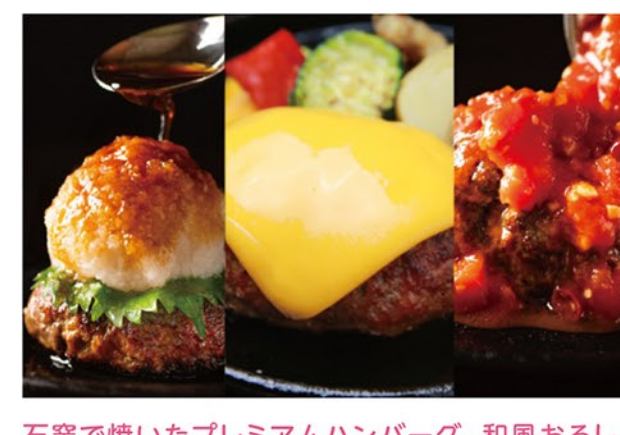
石窯で焼いたプレミアムハンバーグ。和風おろし、チェダーチーズ、ピリ辛トマトソースから1つトッピングが選べます。+200円でライス付きにも!