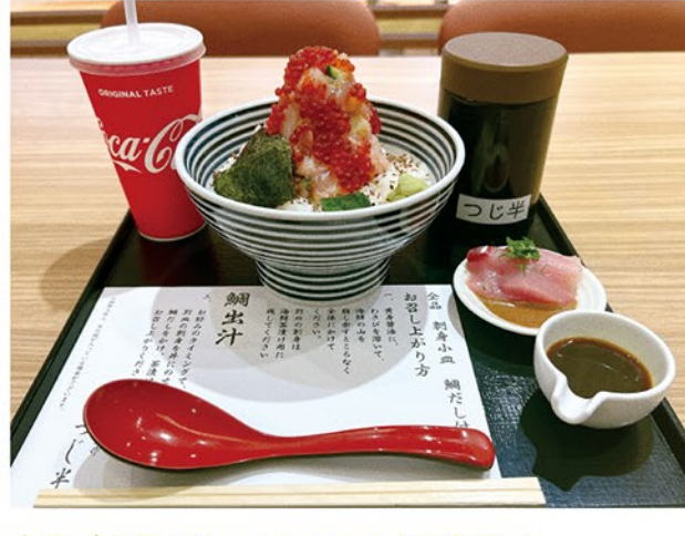
店長が自信を持っておすすめする逸品!!! いくらたっぷりのせいたく丼です。是非ご賞味ください。