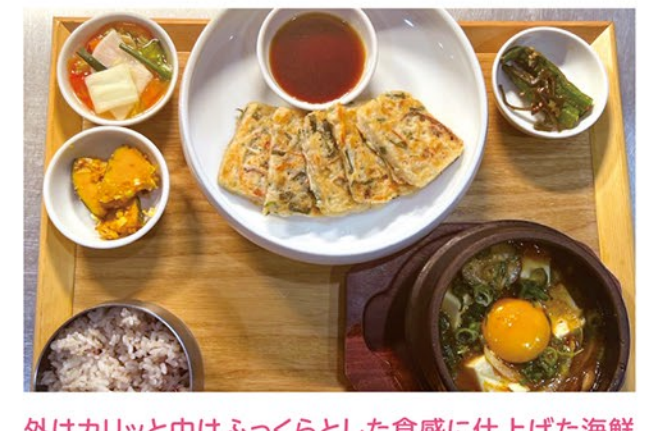
外はカリッと中はふっくらとした食感に仕上げた海鮮チヂミと、こだわりの味噌と自家製コチュジャンで作った辛さがあとを引くヘルシーな海鮮スンドゥブの定食です。