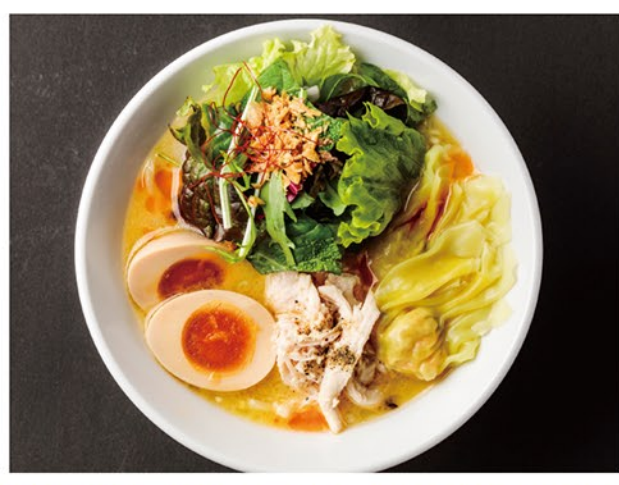
鶏白湯を使った濃厚スープに、大きめの海老ワンタンが入った当店の大人気メニューです!