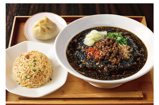
当店オススメ! お店で人気の担々麺と半チャーハンのよくばりセットです。豚まんも付いてお腹いっぱい。