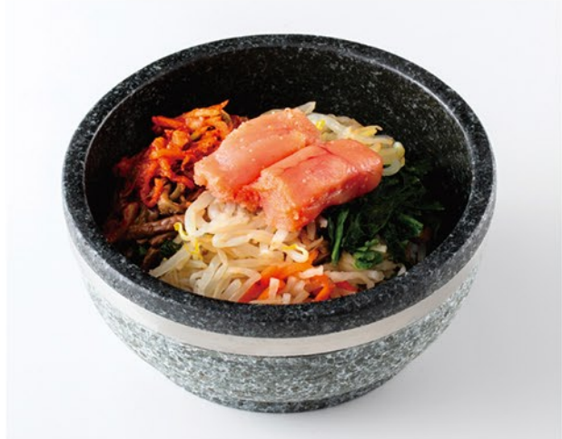
プチプチとした食感をお楽しみいただけます。