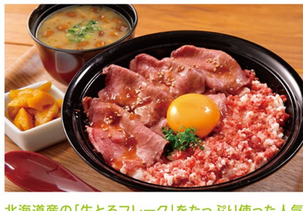
北海道産の「牛とろフレーク」をたっぷり使った人気メニューの「牛とろ&ローストビーフ丼」とザンギ・みそ汁のセットです。