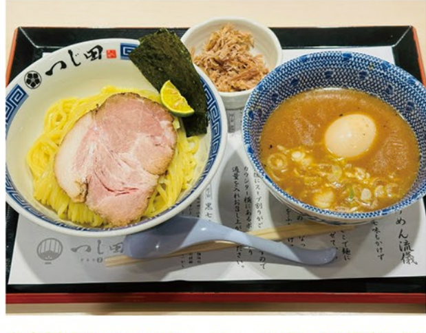
自家製のホロホロチャーシューを崩した「豚崩し」をスープに入れて、ひと味違うつけ麺をお楽しみください。