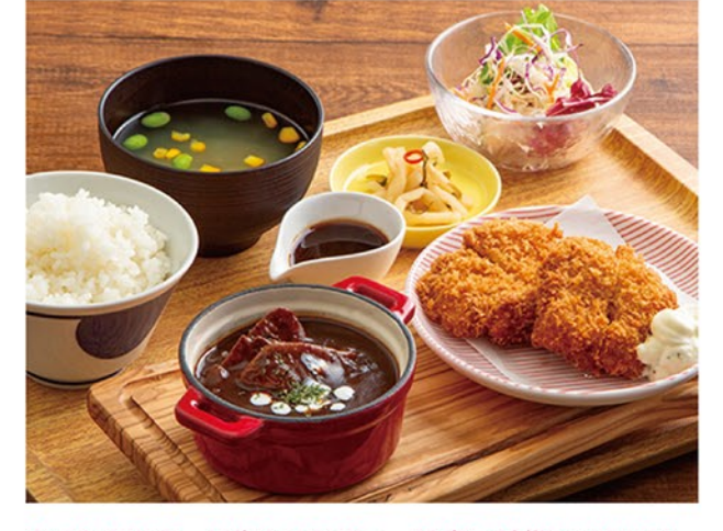
あつたかどろーり牛たんシチューは寒い時期にオススメ。サクッと揚げたチキンカツと一緒にご賞味ください。