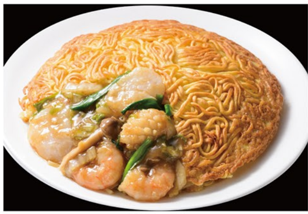
海鮮サチャー醬で炒めた海老、イカ、ホタテ、シメジなどを入れた贅沢な一品です。