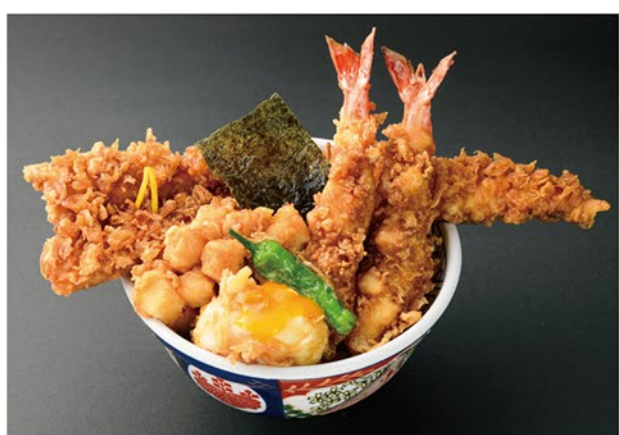
豊洲市場で仕入れた海老、烏賊と小柱のかき揚げ、さらに金子半之助を代表する穴子一本と半熟卵が入った豪華な天丼です。