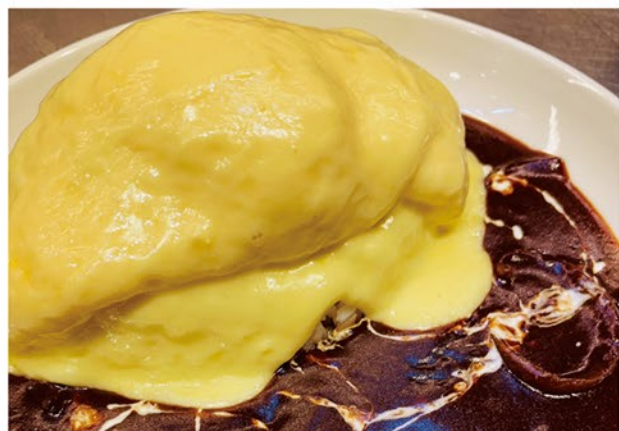
当店一番人気のメニューです。