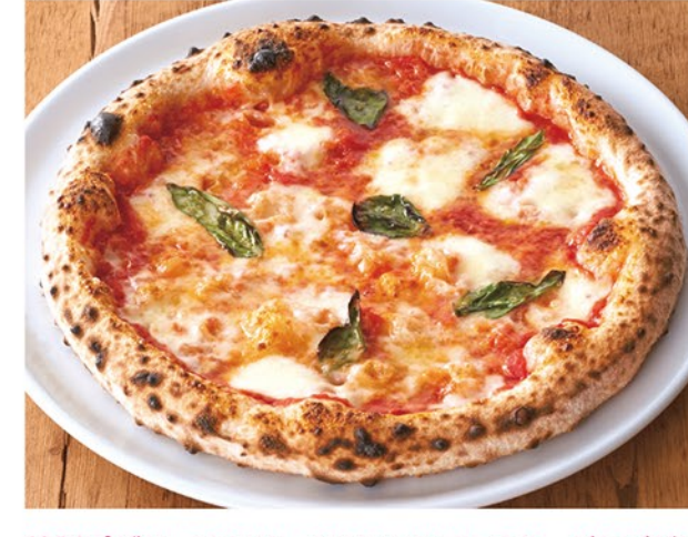
特製ピザソースをベースにモッツァレラチーズとパプリコをトッピングしたイタリアンピッツアの代表格です。