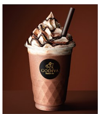
甘さとビターの両方が楽しめるカカオ分50%のショコリキサーと、ふわとろクリームにゴディバチョコのソースとたっぷりのバナナを合わせたクレープのセットです。

ショコリキサー ミルクチョコレートカカオ50% + クレープ ゴディバチョコレート&プレミアムバナナ 1,733円